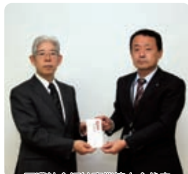
西濃社会福祉事業協力会代表