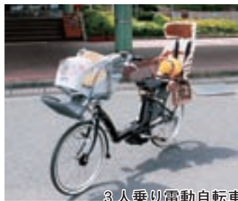
3人乗り電動自転車