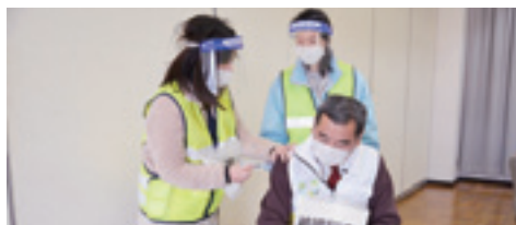
▲ワクチン接種 シミュレーションの様子