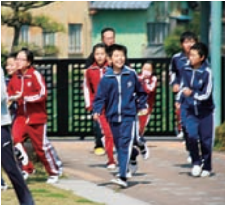
▲ 素早く避難する様子

今回は、新しい学年になって初めての訓練でした。もし、地震が発生したらどのように自分の身を守るのか、教室からどうやって避難するのか、その方法や避難経路を覚えさせました。どの子も机の下にもぐり、ハンカチを口に当て、「おさない・はしらない・しゃべらない・もどらない」の約束を守り、真剣に取り組むことができました。特に、緊急放送が入ったときには、まるで誰もいなくなっただかのように、校舎全体がシーンと静かになりました。入学したばかりの1年生も、緊急放送や担任の先生の話をしっかり聞き、全員が避難することができました。