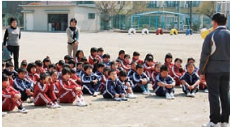
▲ 児童全員が校庭に避難完了

全体指導では、訓練担当の先生から「1個しかない大切な命を守るために、全員が訓練からしっかりと取り組むことが大切です。」と、話がありました。自分の命は自分で守るために、危機意識をどの子も高めることができるように、今後とも内容や方法を考えて訓練を実施していきます。