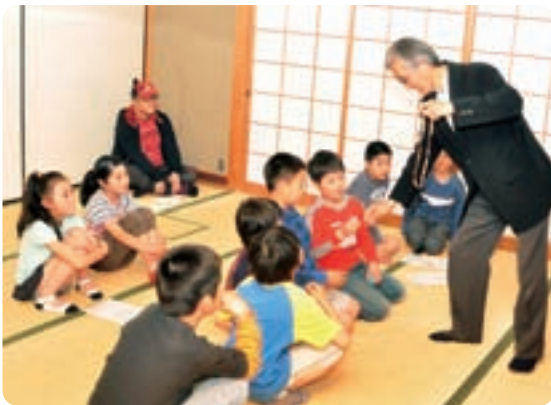
▲各サークルにて (子どもマジック)