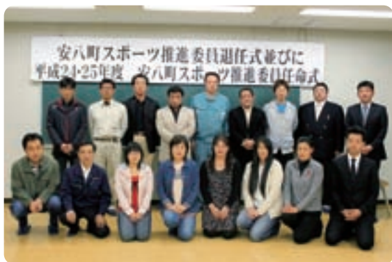
▲スポーツ推進委員に任命された皆さん