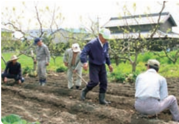
▲こんにやく芋の定植する牧長寿会の皆さん

また、4月24日(火)には牧長寿会の皆さんによるこんにやく芋の定植が行われました。