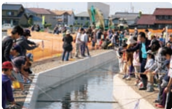
▲ます釣りを楽しむ参加者たち

終了後、参加した子どもたちは、ますで一杯のバケツを手に「こんなにたくさん獲れたよ！」と家族に嬉しそうに見せていました。