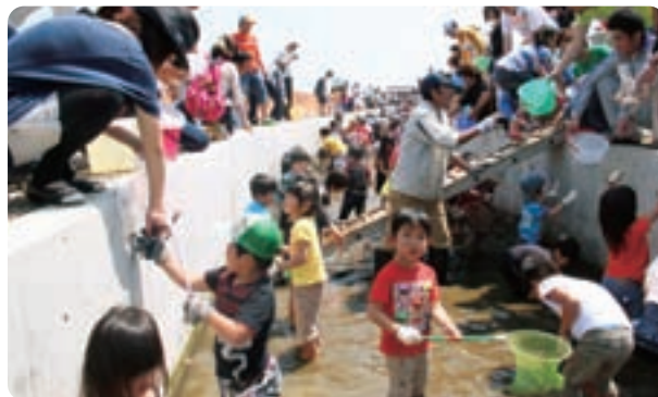
▲夢中でますを捕まえる子どもたち

この大会は、子どもたちに用水路を利用した魚獲りや水遊びを通し、水に親しむ楽しさを知ってもらおうと毎年開催され、今年で14回目となります。