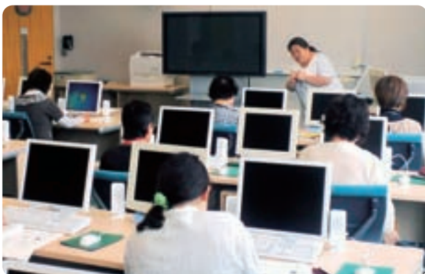
▲パソコンボランティアの方の活動風景

手軽にパソコンを学べる機会を、今後も円滑に提供、運営できるように手を貸してください。 パソコンの技量は問いません。会員がお互いに協力して、学習しながら技量を高めることができます。 興味のある方は、教育委員会にお問い合わせるか、または、ハートピア安八PC研修室へどうぞお越しください。