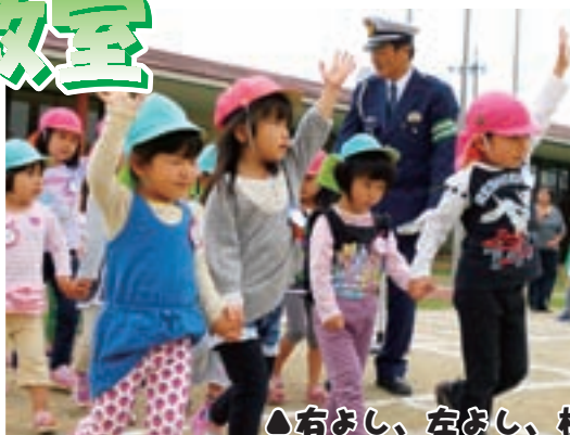
△右よし、左よし、横断よし

リュックはちょっぴり重いけど、目的地に着けば何よりのお楽しみ。手作り弁当におやつ時間!! 満面の笑みでおいしくいただきました。