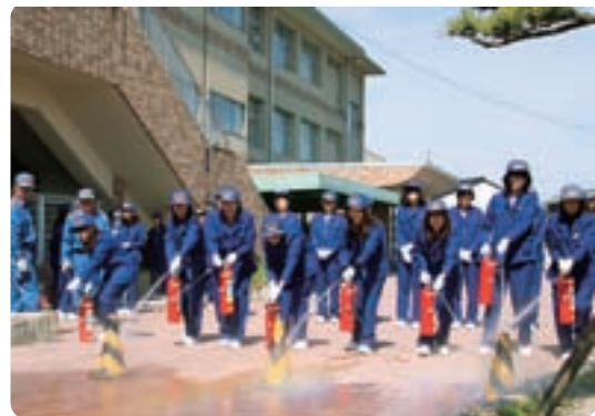
▲水消火器による初期消火訓練

また、5月13日（日）には町女性防火クラブが名森小学校運動場で全体訓練を行いました。