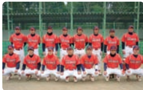
▲岐阜日野自動車株式会社野球部の皆さん

皆さまの熱いご声援を力に変え上位入賞を目指してがんばりますので応援をよろしくお願い致します。