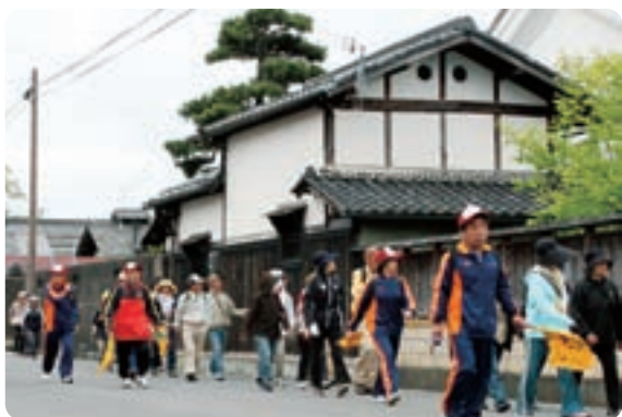
▲歴史を感じるコースを歩く参加者