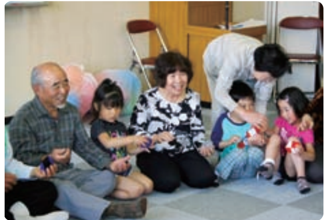
▲手遊びを楽しむ参加者

昼食には、同会食事ボランティアの方の手作りまぜご飯をいただきながら地域のホットニュース等、積極的にコミュニケーションを深めていました。