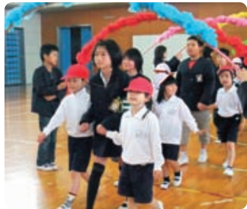
▲上級生と手をつなぎ入場する1年生