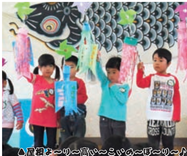
△屋根よ〜り〜高い〜こいの〜ぼ〜り〜♪