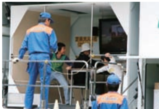
▲激しい揺れを体験する訓練参加者

参加者らは、揺れが大きくなると手すりや机に必死につかまり、地震の怖さを改めて認識していました。