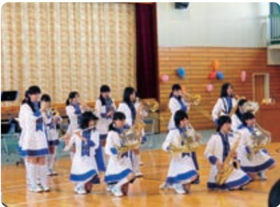
▲マーチング演奏を披露する吹奏楽部

今年は、初めてマーチングに挑戦しました。少ない時間の中で、動きとメロディーを揃えることを大切に組み組んできた練習の成果が披露された演奏でした。