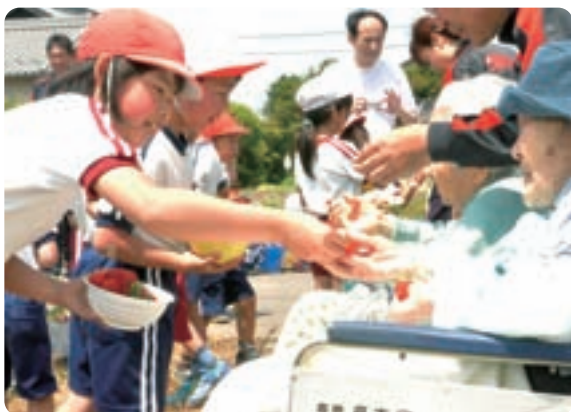
▲もぎたてのイチゴを思いやりの言葉といっしょに

この交流会は、相手を思いやり、誰に対しても優しく接する態度を培うことをねらいに、毎年行われています。