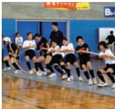
▲チーム一丸となって綱引きをする参加者

安八町からは、結バレー、名森バレー、牧野球、名森サッカー少年団から43人が参加し、綱引き大会やレクリエーションを行い、西濃管内の少年団員との親睦、交流を深めました。