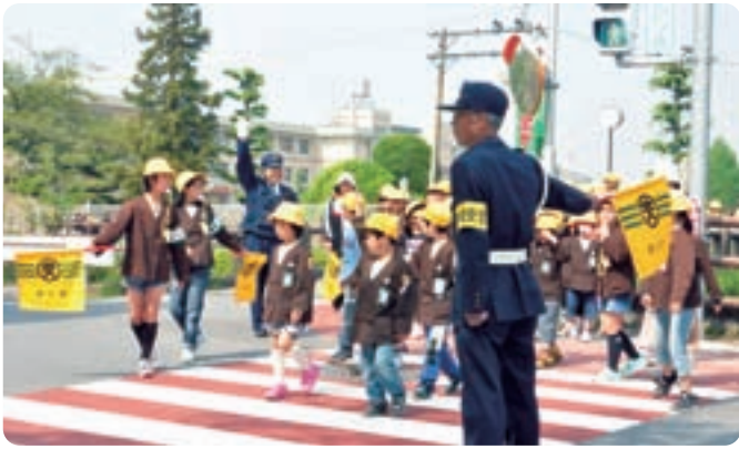
▲交通安全教室に参加する小学生

当日は、大垣警察署交通課の方と安八交番所長から、登下校時の注意点や安全旗・笛の正しい使い方などについて話を聞きました。その後、実際に道路に出て、交番所長や学校安全サポーターの方に、横断歩道の渡り方の指導を受けました。