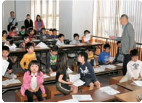
▲各サークルにて (子ども将棋・囲碁)