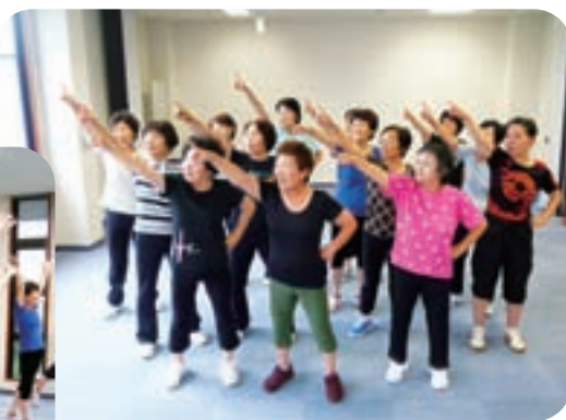
▲岐阜清流国体開会式に向けて練習する皆さん