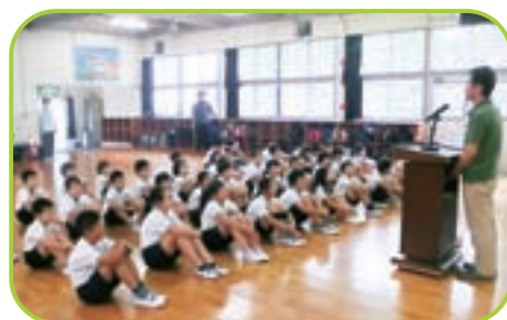
▲ 緊張ぎみの入所式