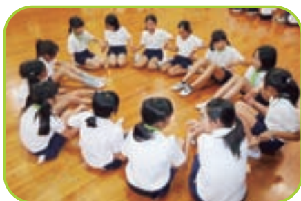
▲ 笑顔でレクリエーション