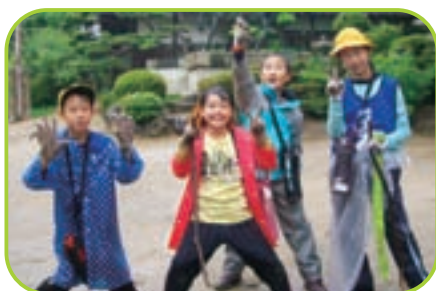
▲ 大自然の中をウォークラリー