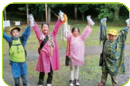
▲ 仲間と協力してゴール達成