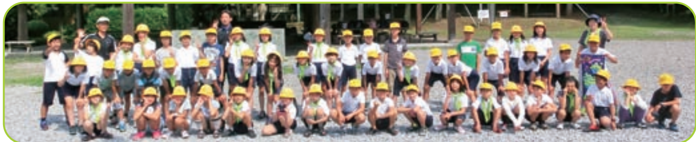
▲ 2日間の思い出は一生ものです