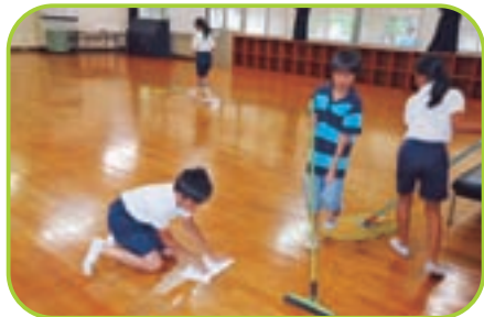
▲ 来たときよりも美しく