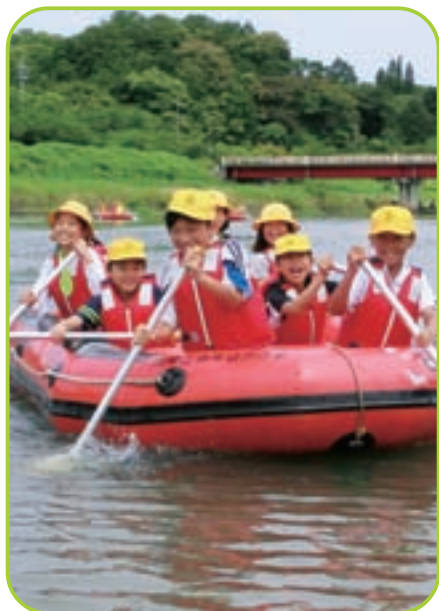
▲ リバーポート体験で大歓声