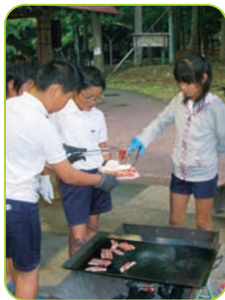
▲ おいしく楽しむバーベキュー