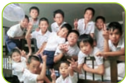
▲ 1日目終了！また明日が楽しみだ