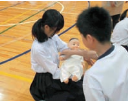
◀ 仲間と男女交際について考えます

1年生は、胎児シミュレーターを使ったり、実際の妊婦さんのお腹に聴診器をあてたりして、胎児の「命」に触れることができました。「うっくん。どっくん。」という胎児の鼓動に、生命の神秘を感じるとともに、お父さん、お母さん、おじいさん、おばあさんを含めた何世代もの命のつながりに、感動していました。