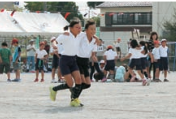
▲ 前回(平成25年度)の様子【結地区】