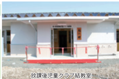
放課後児童クラブ結教室