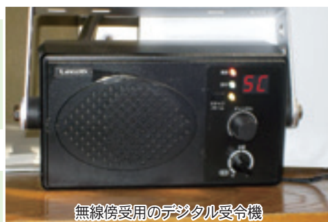
無線傍受用のデジタル受令機