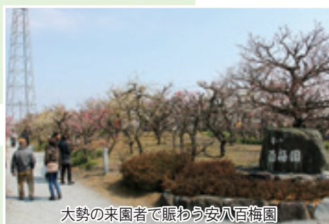
大勢の来園者で賑わう安八百梅園