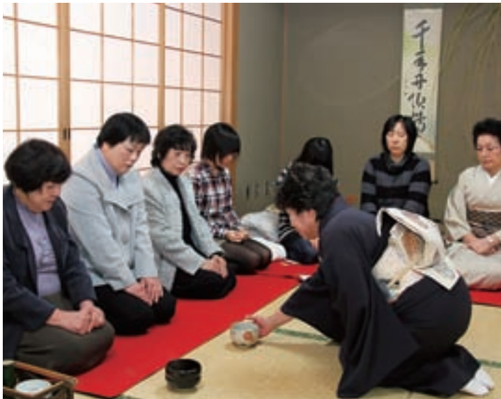
▲ 日本の伝統文化を「茶」とともに