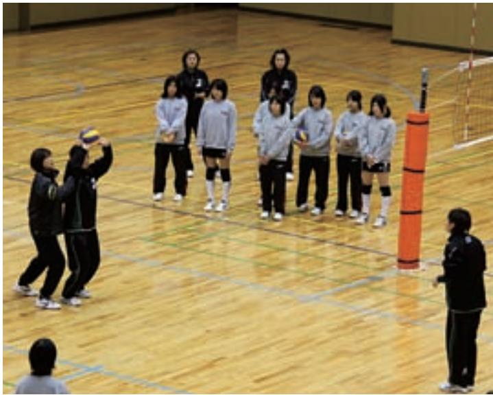
▲ 模範演技を見ながら指導を受ける参加者たち