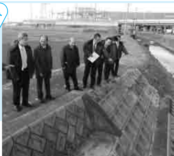
大江川の改修工事の現場を視察しました