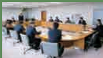
山梨県北杜市 議会広報編集委員会

2月1日に山梨県北杜市、2月6日に岐阜県高山市の議会だより編集委員会が、視察に来られました。いずれの市も議員が手作りで議会だよりを編集しておられます。当委員会の編集方法などについて活発に意見を交換しました。