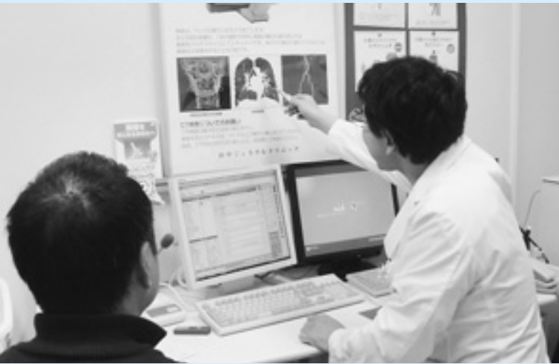
医師会との連携で、ガン予防教育を