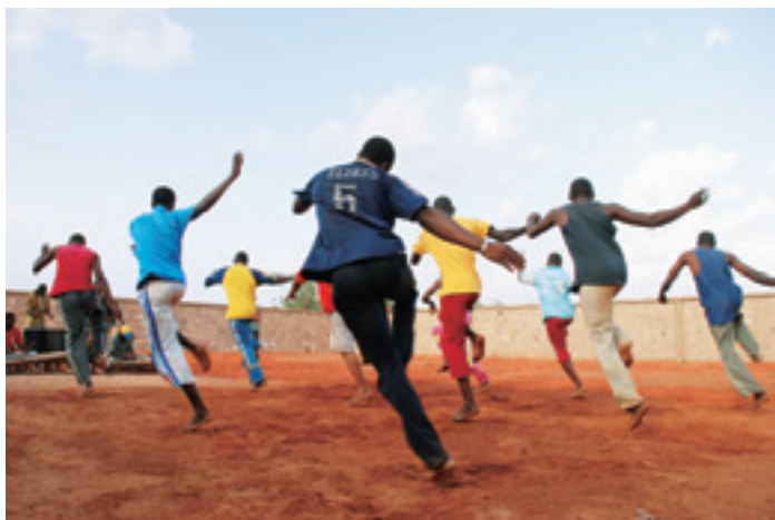
貧しくても心豊かなブルキナファッソ国の若者たち 太鼓のリズムさえあれば、たちまち踊り始めます