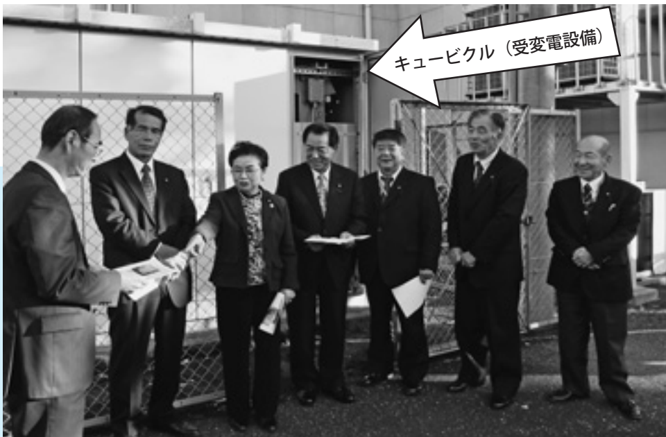
給食センターのキュービクル（受変電設備）の前で説明を受けました

のうち、安八町の負担はいくらですか。 福祉主幹 町の負担は4分の1です。それ以外は国と県の補助金です。