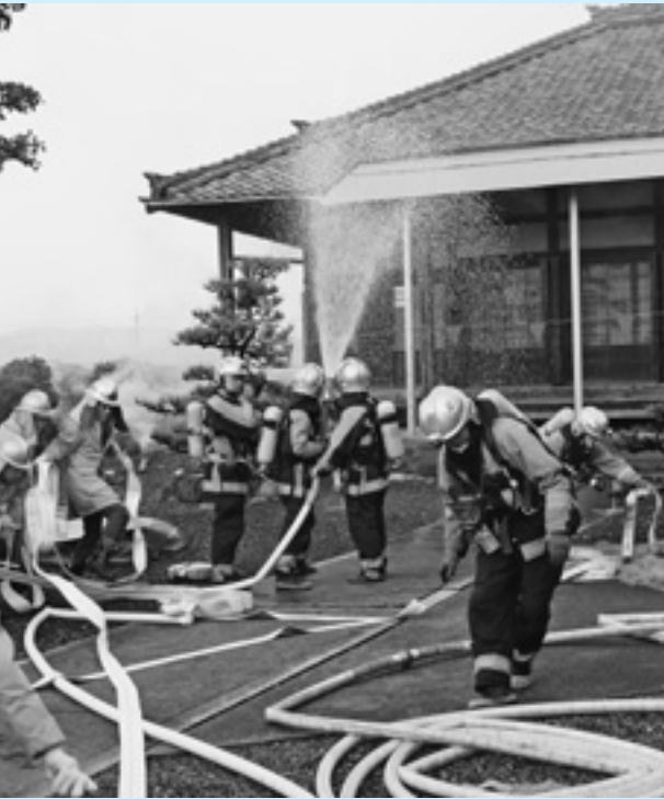
文化財を所有する浄満寺（北今ヶ淵）での防火訓練の様子