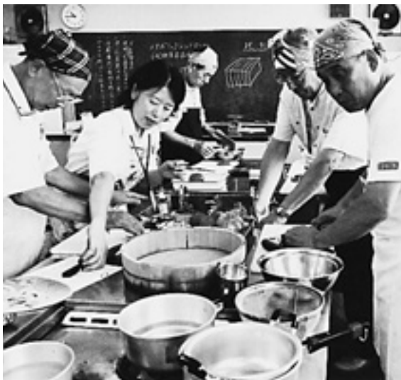
野々市市の講座の一例「メタボ撃退クッキング」