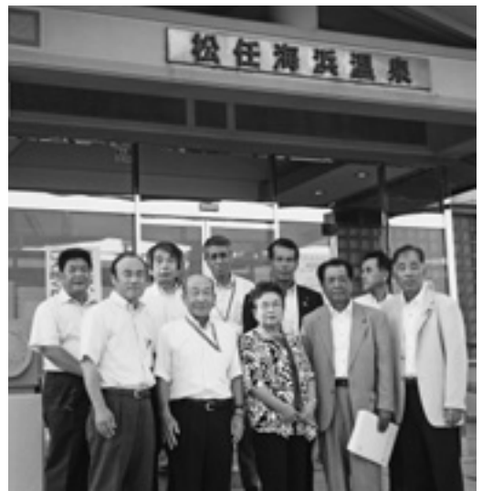
健康増進と交流の場である松任海浜温泉