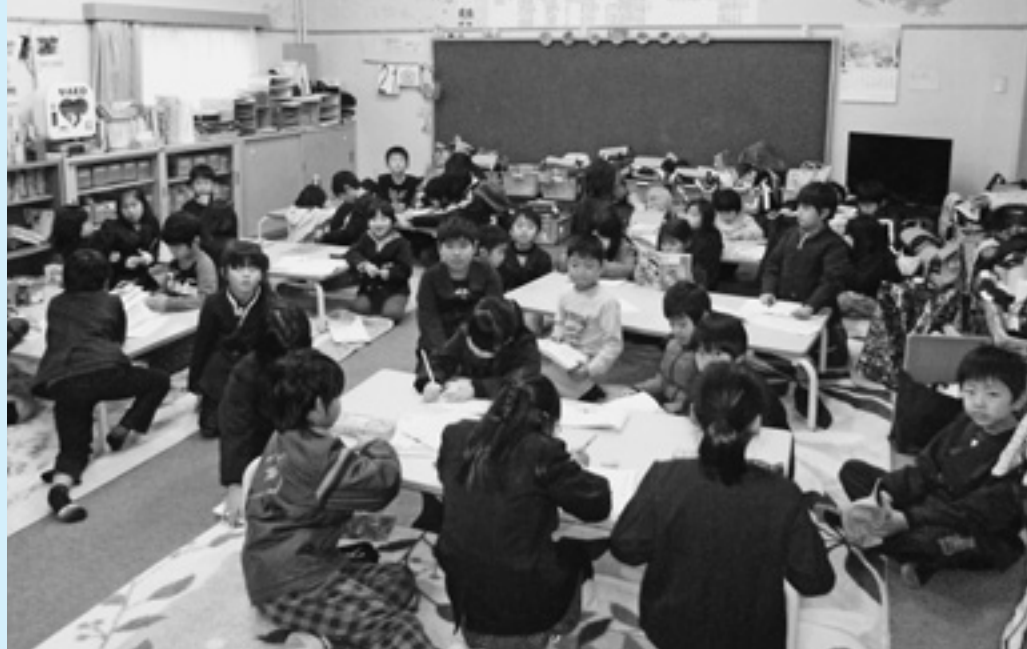
利用者が増え、手狭になった放課後児童クラブ結教室