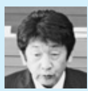
安井 忠 ますこと やすい

たが、安八郡3町を比べて職員数をもっとも多く、人件費率がいちばん高いという結果が出ています。