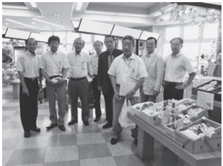
明るい雰囲気、果物の香りいっぱいでした (ハッピーパークにて)

南アルプス市は市商工会と、指定管理者制度で、平成17年12月に地域農産物の生産、加工、販売により地域の活性化を目指し、総合交流ターミナル「ハッピーパーク」発足の基本協定を交わしました。 ギネス登録のスモモ「貴陽」を始め、桃、ブドウ、果物加工品などを販売しています。今では月に一回、商工会とJAが会合を持ち、観光振興策にも取り組んでいます。 生産は農家、加工は企業、販売は商工会と、それぞれの得意分野で力を発揮し、ハッピーパークという交流施設で繋がり、市の発展に貢献していると感じました。