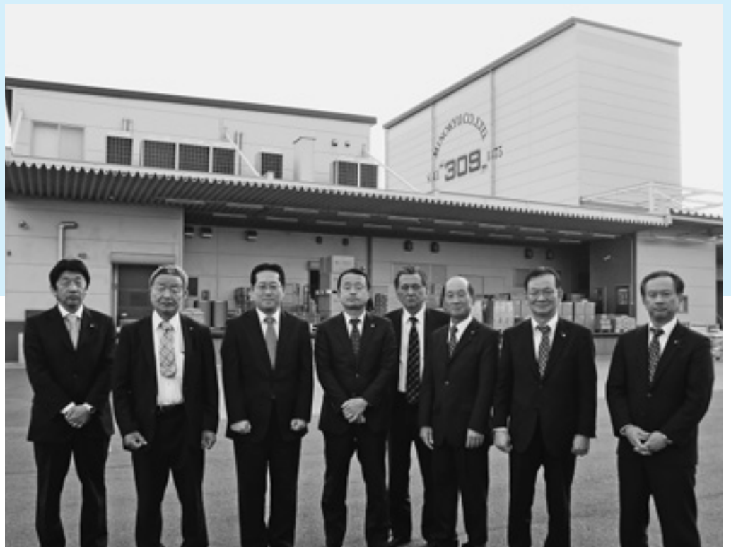
からし類を製造している（株）美ノ久岐阜工場を見学しました（中地区）

Q 今回、暴力団排除条例の一部が改正されました。この条例の暴力行為を抑止するところが趣旨を町民に徹底するところが大事ではないですか。 総務課長 暴力追放センターと協調して、町民への広報を行います。