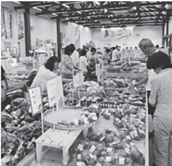
午後には売り切れの人気商品もあるとか (きなあた瑞浪)