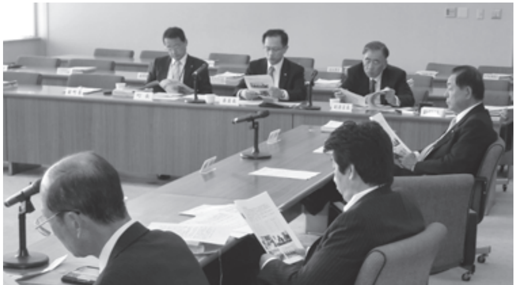
議会改革特別委員会で、今後の議会活動のありかたの議論を始めました