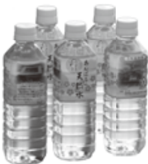
5年保存できる「あんぱちの天然水」

これに伴い、表示看板の設置、避難所におけるプライバシー保護のための間仕切りや、災害時における分婉セツトを購入し、5年保存水「あんぱちの天然水」を生産します。非常用食料を今年も購入し、万が一の災害に備えます。