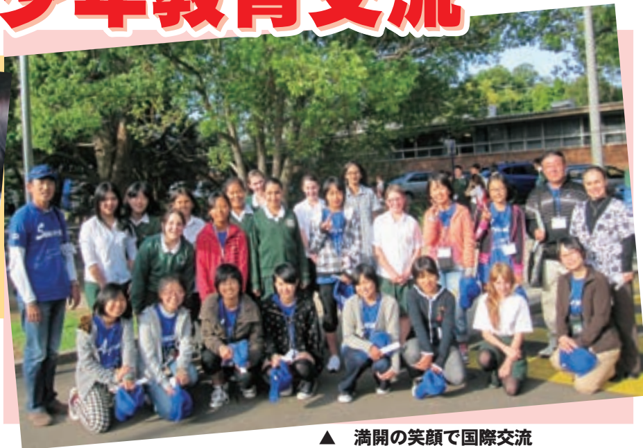
▲ 満開の笑顔で国際交流 (カンバーランド高校)