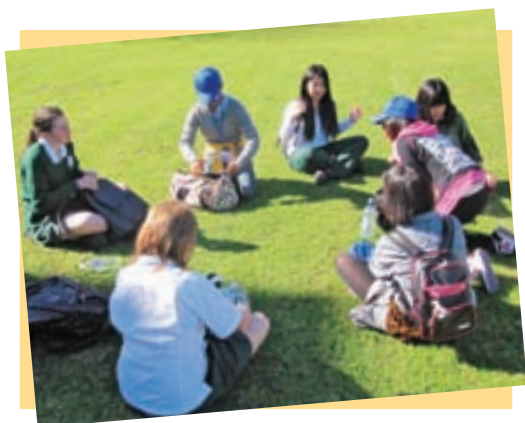
▲ 穏やかな気候(パラマタ市内の公園)

緑豊かな環境で現地の人たちとふれあいました。積極的にコミュニケーションを交わし、理解し合うことの大切さを学びました。