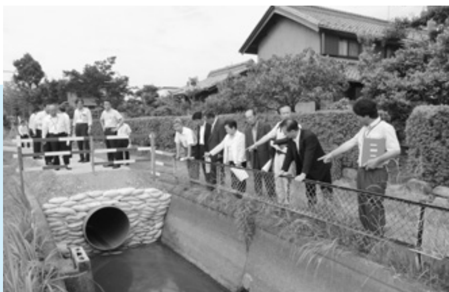
パイプライン化された揖斐川以東用水を視察（森部一色地区）

は、平成6年に増築しましたが、その時に設置したものです。 Q 災害対策の面から、庁舎や公民館の壁面の打音検査が必要ではないか？ 総務課長 庁舎増築時に打音検査を行っていますが、以降は実施していません。検討をします。