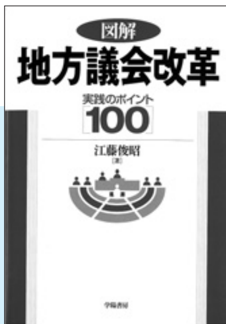
購入する議会改革関連書籍

三重県議会など、改革を進めている議会では、議員と執行部の役職を兼務することは、法的な裏付けがある場合を除いて、基本的にやっていません。そこで、安八町議会の状