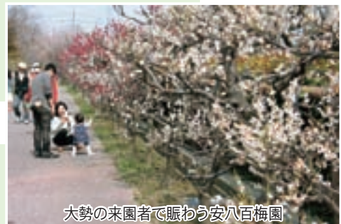
大勢の来園者で賑わう安八百梅園