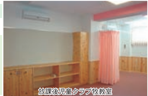
放課後児童クラブ牧教室