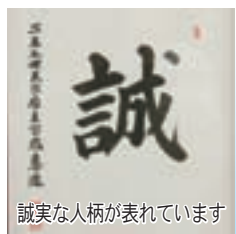
誠実な人柄が表れています