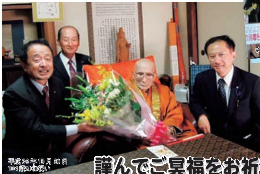
平成26年10月30日 104歳のお祝い