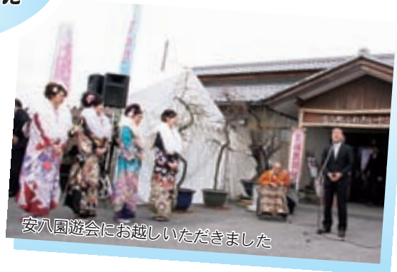
安八園遊会にお越しいただきました