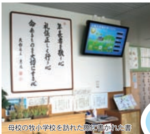
母校の牧小学校を訪れた際に書かれた書