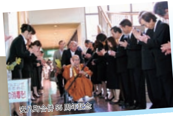
安八町合併 55周年記念