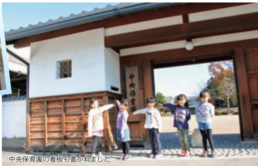
中央保育園の看板も書かれました