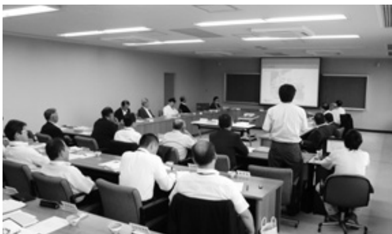
ネクスコ中日本から説明を受けました