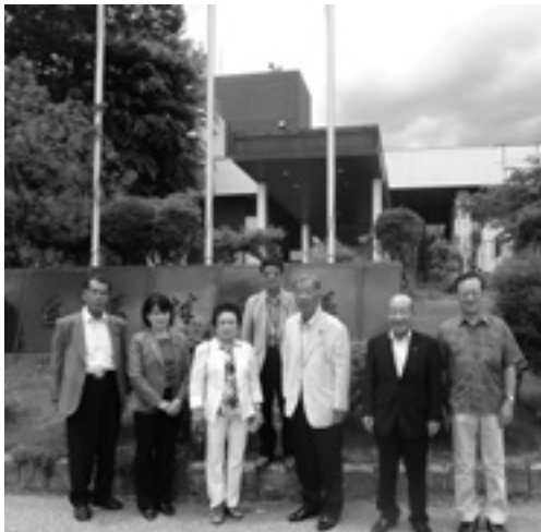
白馬村役場の視察

社会福祉協議会では、ボランティアの方の取りまとめをされ、延べ 1700 人の方が、被災家屋の整理に來ていただいたということでした。