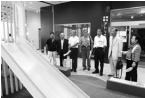
テラスゲート土岐 (子ども向け遊具も完備)

この施設は、平成 27 年 4 月にオープンし、日帰り温泉・地域セレクトショップ・カフェの楽しめる施設で、「地域のヒト・モノ・コトをつなげる」を