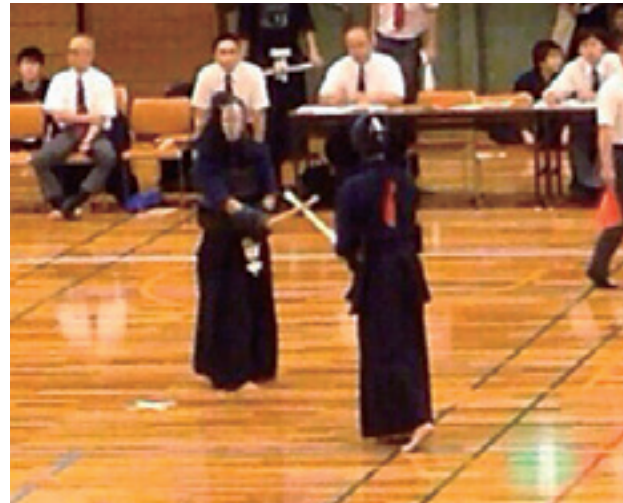
全国大会出場を決めた東海ブロックの試合(愛知県)

は続け、この町の剣道を盛り上げることに協力していきたいと考えています。 今までいろいろな先生方からご指導をいただいた恩返しとして、自分の経験を生かして地域の子どもたちに剣道を教えていきたいです。