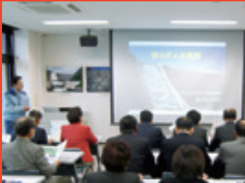
徳山ダム管理所にて

議会の傍聴にお越しく下さい。 今月の議会定例会は、12月8日から17日です。初日8日と最終日17日の傍聴ができます。いずれも10時開会です。