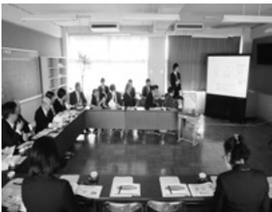
登龍中学校の空調設備説明 (3月3日)

4方式(所得割・資産割・均等割・平等割)は大垣市、海津市、養老町、垂井町、関ヶ原町、揖斐川町、池田町です。