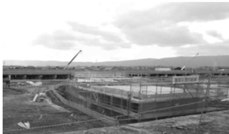
(仮称) 安八SIC建設工事現場の様子（12月現在）

現在、ほぼ基礎部分の工事が完了し、今後は目に見える形で工事が進んでいきますので、地元の方や小中学校へ現地見学会の案内をしていきたいと考えています。また、町民の皆様にも時期を調整し、現地見学会の募集などもしていきたいと思えます。