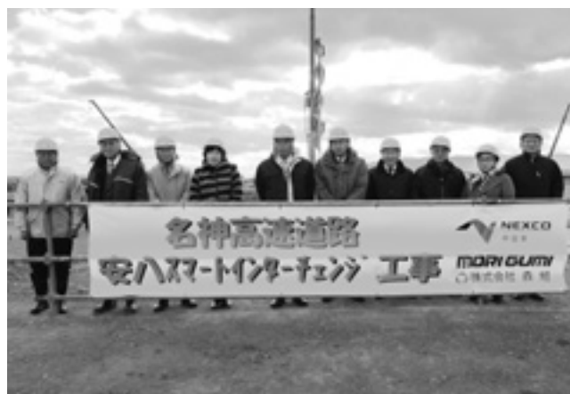
SIC建設工事現場を視察しました