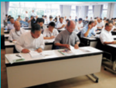
真剣な表情で受講する編集委員

7月5日(水)、議会だより編集委員が全国町村議会館（東京都内）で、議会広報の発展に資することを目的とした、全国町村議会議長会主催の同クリニックを受講し、「あんぱち議会だより」の添削・指導を受けました。