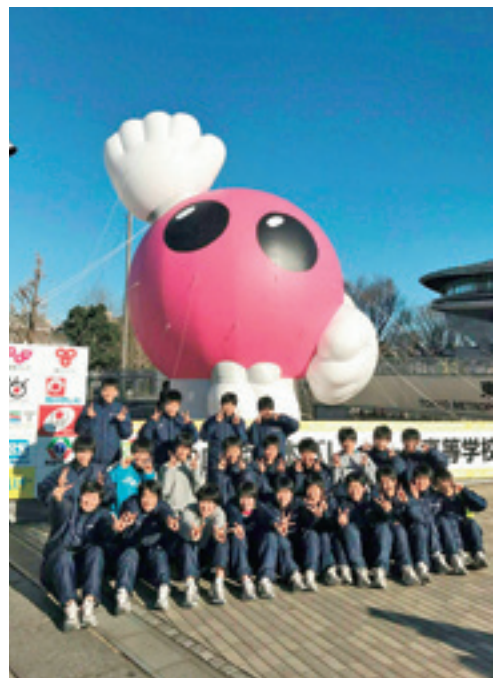
「春校バレー」が行なわれた東京体育館前