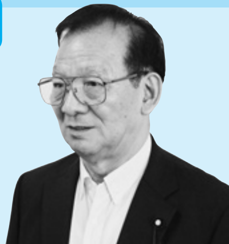
お岩 いわ まつ 松 にし 西