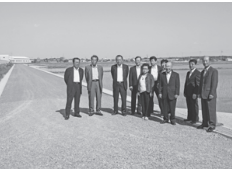
安八スマートIC周辺の道路拡張工事に伴う舗装工事予定地を視察しました（中地内）

建設課長兼S・I・C建設推進室長 名森小西側交差点への信号機設置に向けての進捗状況は、以前に概略設計を行ない、危険交差点であるため警察に強く信号機設置の要望しており、2カ月前に現地確認をしてもらいました。その後、県警からはS・I・C完成後の車両の流れの予測がつかないので、開通後に調査をしてから、再度検討する旨の回答を得ています。