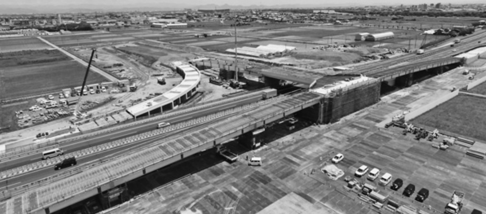
5月16日（火）、名神高速道路本線上に設置された跨道橋（こどうきょう）と、下り線の乗り降りルートが接続しました（7月6日現在）