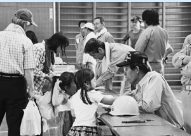
避難所開設に向けた訓練で受付をする住民 (5月21日/中組区防災訓練にて)

えます。当町では作成してありますか。 回答 県では、平成28年の熊本地震、近年の台風や集中豪雨