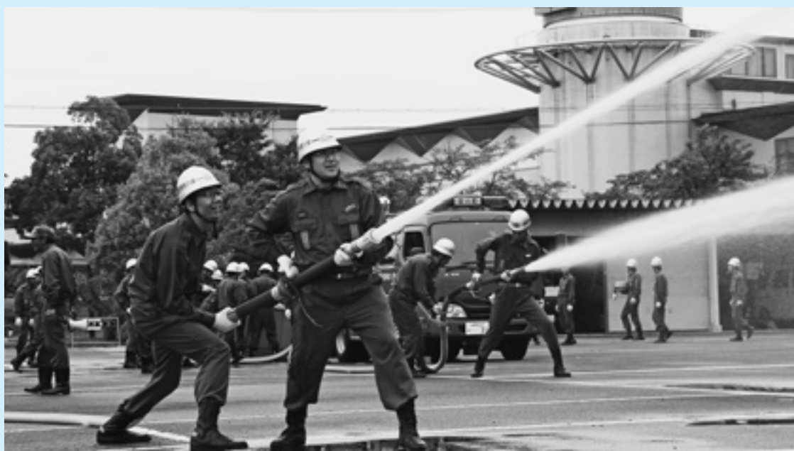
消防団員の人たちは、日頃から訓練を行なっています（6月25日／火災防ぎょ訓練にて）

力所あります。町内すべての地区で活動が行なわれていくよう、今後の課題として取り組みます。