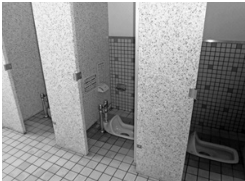
和式トイレから洋式トイレになります（結小学校）完成は9月末予定