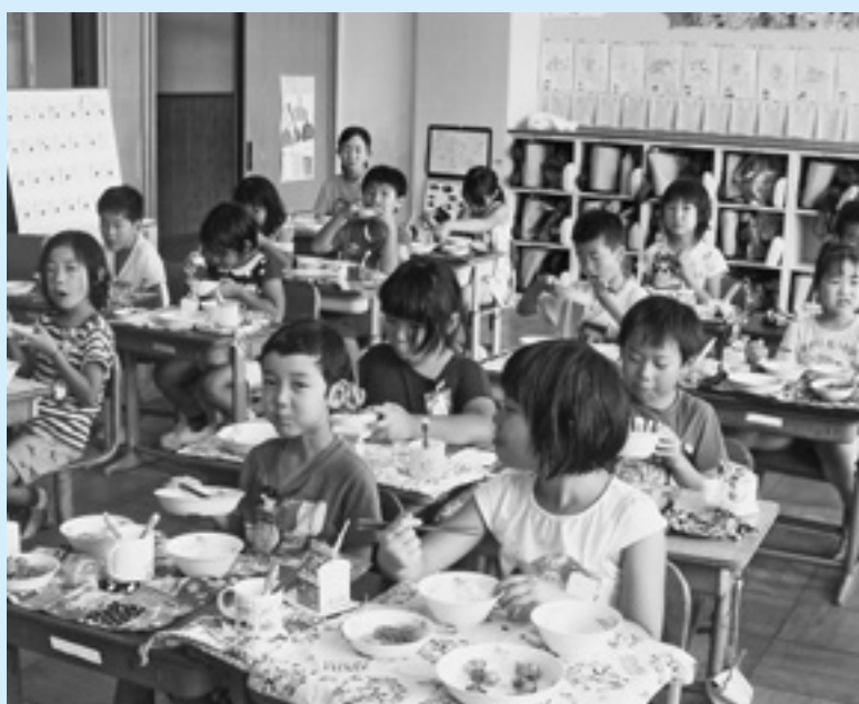
メニュー豊富な給食に舌つづみを打つ児童たち（名森小学校）

で、給食指導、紹介を しています。一方、学 校の給食主任は、年度 始めに全員の先生に、 「手洗い・配膳等の進 め方」、アレルギー等 の「給食管理」、「教科・ 道徳・特別活動との関 連」などの全体計画書 を作成し、理解を図っ ています。また、家庭 科の時間には年20時間 食に関する授業があり ます。学級活動の時間 には「朝食と運動」、 学年集会では「朝ご飯 の大切さ」などを考え る指導をしています。 また、毎日の「給食」 時間には「旬の食材・ 地元食材」「配膳・片 づけ」のルールなど、 望ましい食習慣を育成 しています。献立も「国 際食」「行事食」「郷土 食」「セレクト食」な ど工夫しています。