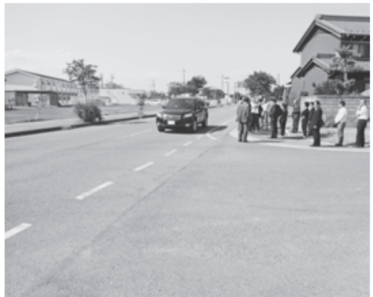
今年に入り、交通事故が多発する県道安八～平田線を視察し、その対策等について検討しました（南條地内）