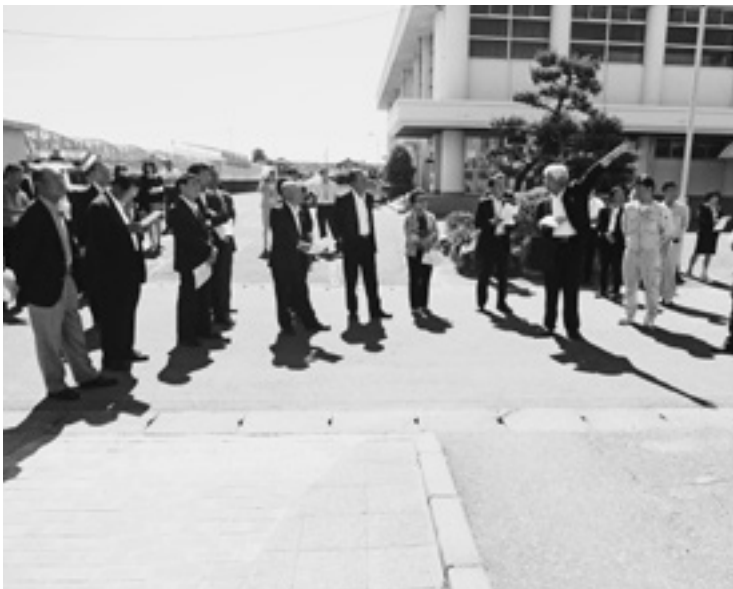
エアコン設置予定箇所を視察（結小学校）完成は9月末予定