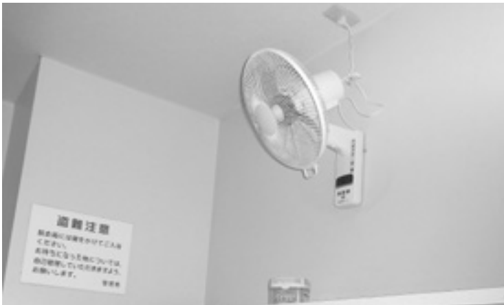
7月11日、男女脱衣室に各1台扇風機を設置しました

に3万円の寄附がありました。消耗品などの購入ではなく、寄附された人に対し、目に見える形での備品購入をお願いします。