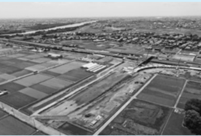
産業振興が期待できる安八スマートIC周辺