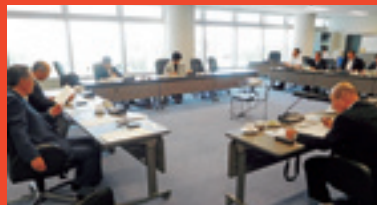
より親しまれる議会だよりを目指して (三重県菰野町役場にて)