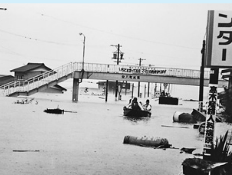
9.12安八水害（役場南付近）