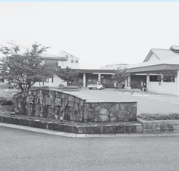
老朽化対策を含め抜本的な見直しが求められます