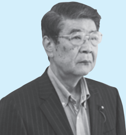
お 昭 夫 あ き い 井 昭 夫 う す

しかし、施設の老朽化をはじめ周辺の環境整備など多くの課題もあります。幅広い年代層に対応した新たな機能の導入など、老朽化対策を含め抜本的な見直しが必要と考えています。厳しい時期ですが、優先順位を定め、計画的、効率的に取り組んでいきます。