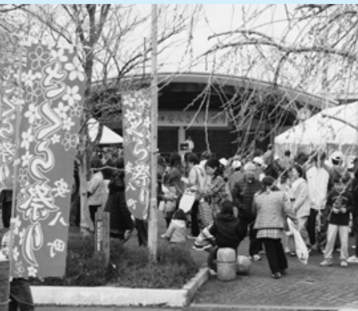
イベントにより新しい地域コミュニティの振興を図ります

そこで、既存のイベントの発展的見直しや、新たなイベントの立ち上げについての所見を伺います。