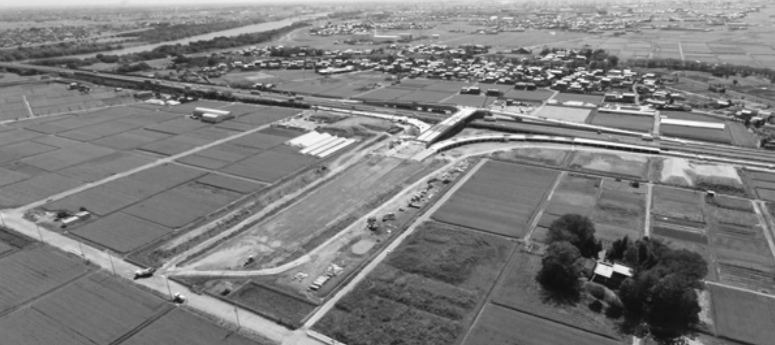
安ハスマートインターチェンジ建設工事現場 (H29.9.21現在)