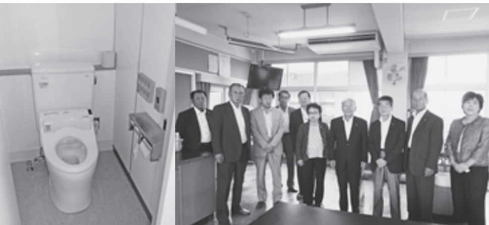
完成した洋式トイレとエアコン設備 (結小学校)

学校教育課長 毎月点検する項目と、年に1回の法定点検があります。児童・生徒等の命を預かる乗り物ですから、法に沿った点検を厳守しています。