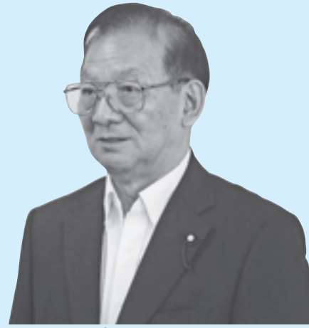
いわお 巖 まつ 西