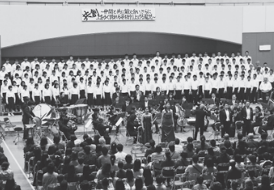
登龍中学校第九合唱20周年記念 (H28.11.5)