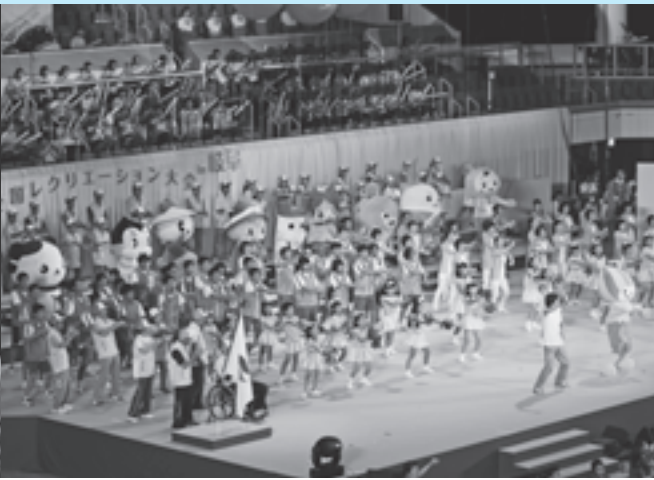
全国レクリエーション大会 in 岐阜 (H28.9.23)