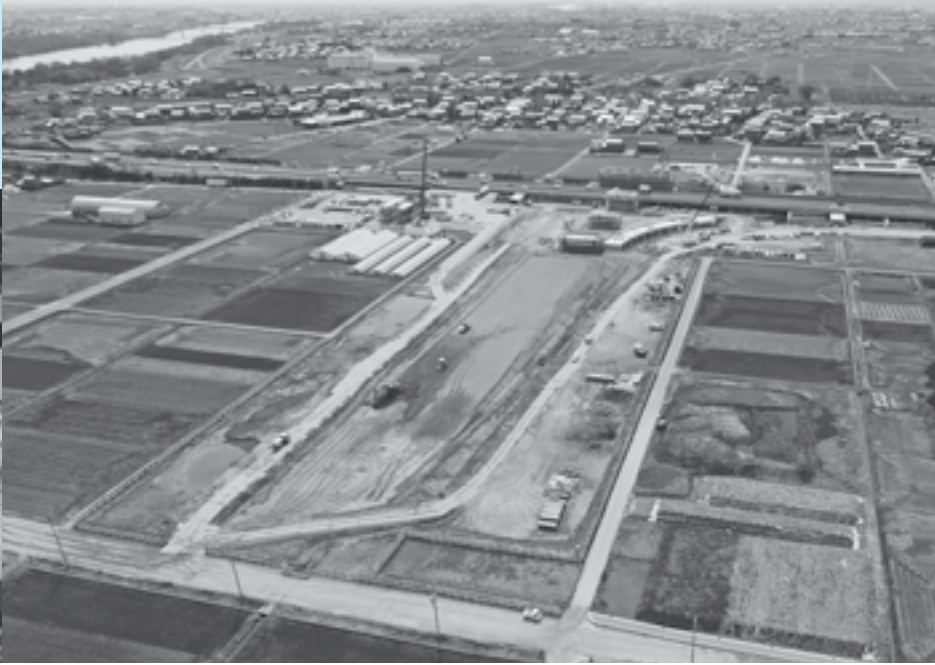
安八スマートインターチェンジ建設工事始まる (H29.3.25 現在)