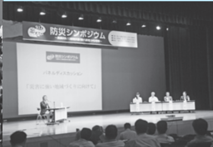
安八水害から40年「防災シンポジウム」(H28.9.12)