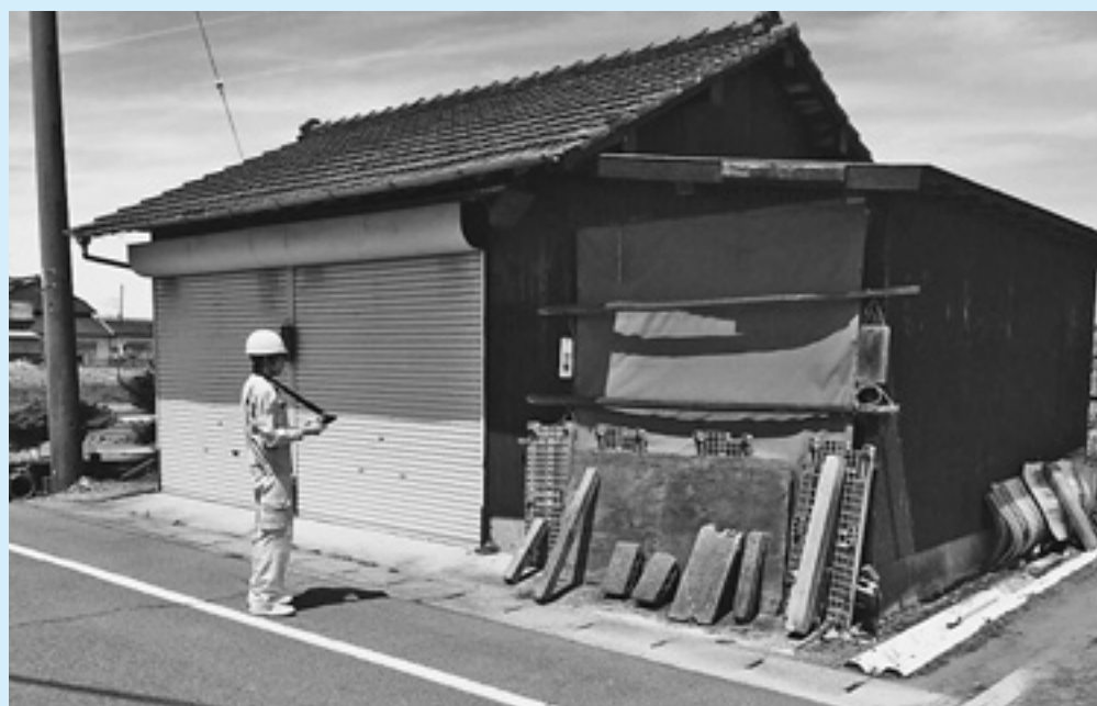
今後、空家等の適正管理が求められます

却や貸し出しといった活用については、空家バンクの設置が必要です。しかし、既に実施している市町村において空家等の解消につながっていないのが実情のようです。 上での基礎資料となるものと考えますので、空家バンクの設置を進めていきます。