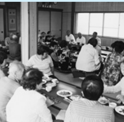
長寿を保つ食事が楽しみです

います。現在は、低年齢層を中心とした施策に重点を置き、保育料の町独自の軽減措置や出産祝い金、給食費助成などを実施しています。さらにエアコン設置等の改修事業、認定こども園化への移行経費、保育園の統廃合に優先的に予算配分をしています。その後、定住化施策とともに総合的に考えて検討します。