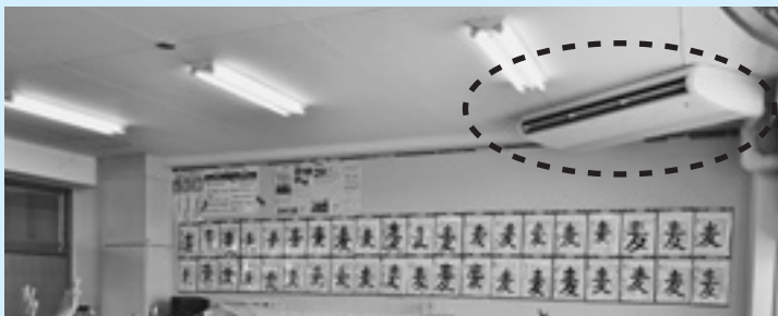
全小中学校にエアコン設備を整備 (写真は名森小)

回答 平成28年度に、東安・登龍両中学校にエアコンを整備しました。また、小学校的エアコン設置も、補助事業として財政的に有利に進められるように、計画年度を前倒して申請していたところ、国の大型補正予算の編成で、整備されることとなりました。また、結小学校のエレベーター設置は、名森小学校にエレベーターを設置した経緯などを踏まえ、昨年度、国の補助事業として申請したところ、小学校のエアコン設置と同様に採択されました。今後は、前もって整備計画等を提示し、議会でも十分議論できるように努めます。