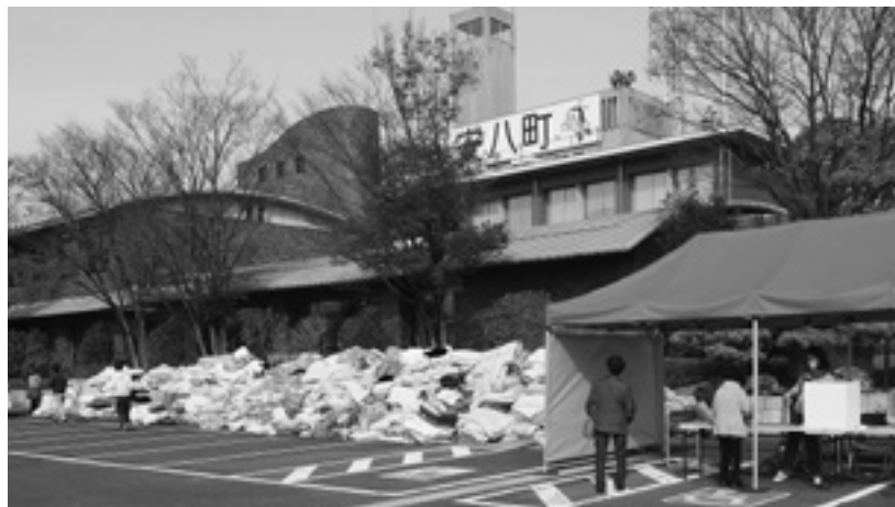
今回も山積みのごとん、燃料にリサイクルされます(11月26日)

住民環境課長補佐 今回の回収量は1039枚、処理手数料は51万9500円、申請者は274人でした。また、第1回(5月実施)の実績は、回収量1154枚、処理手数料は57万7000円、申請者247人で1割増えましたが、回収量は1割程度減少しました。本事業は平成30年度も継続予定です。