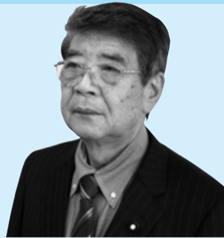
お 昭夫 あき 昭夫 い 昭夫 うす 昭夫 確 昭夫