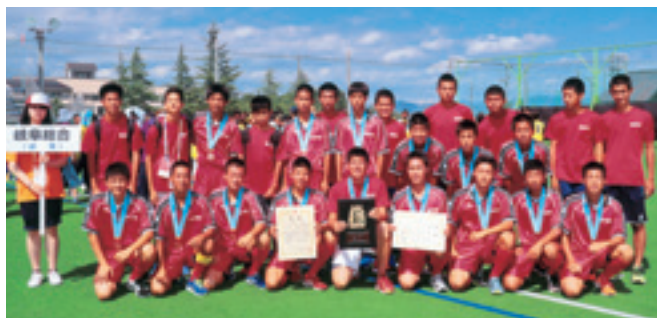
県立岐阜総合学園高校男子ホッケー部の皆さん