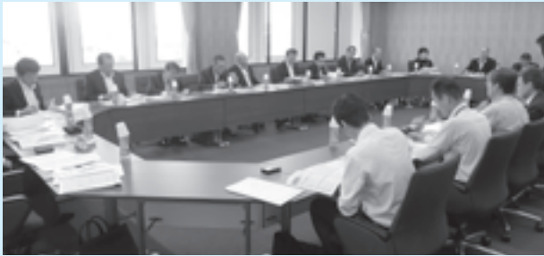
企業誘致のための土地利用計画を策定した北名古屋市に学ぶ(10月4日)