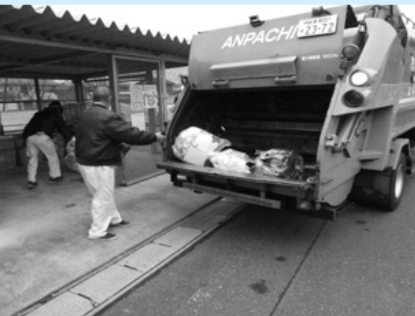
各地区のゴミ集積場から収集します