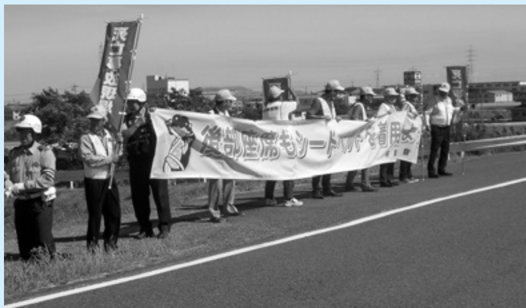
交通事故防止の啓発活動を行う交通安全協会役員の皆さん（揖斐川堤防左岸堤）

見通しのきかない交差点では、カーブミラーの設置位置の変更や、視認性を高めるために道路の外側線（白線）の引き直しを計画しています。