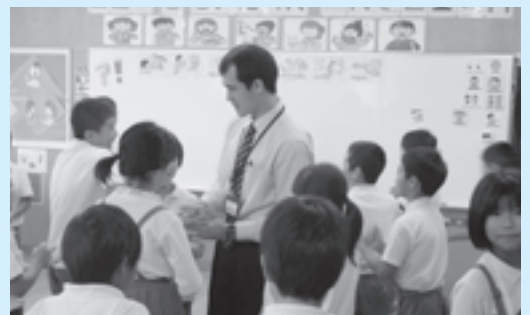
ALTによる英語授業(10月5日)

また、小学校6年生時のALTが中学1年生になっても持ち上がり、担当となり、英語に対する安心感を生徒に持たせ、英語教育が中学校で円滑に移行するよう工夫されています。