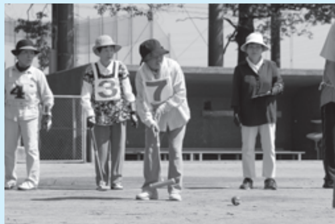
軽スポーツを楽しむ老人クラブ会員の皆さん