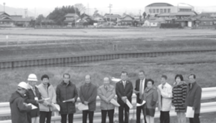
大江川遊水地にたまった土砂を取り除く工事説明を県職員から聞きました(南條地内)

総務課長 従来、各地区が防災用備品を整備する際に、補助率3分の2、上限10万円補助で10年間ほど実施してきましたが、熊本地震等により、平成29年度から4倍に増額して、上限40万円補助で実施しています。今後も備蓄食料、AED等の防災用備品の購入について区長会等で周知していきます。