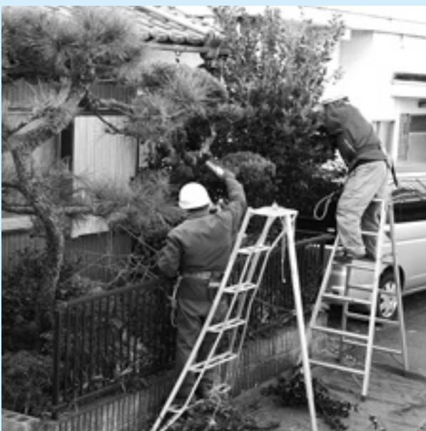
寒風の中、奉仕の心で作業をする会員の皆さん

回答 今後はセンター の事業拡大を目 指し、有益な仕事の確 保に努め、早期の法人 化に向けて支援してい きたいと考えています。