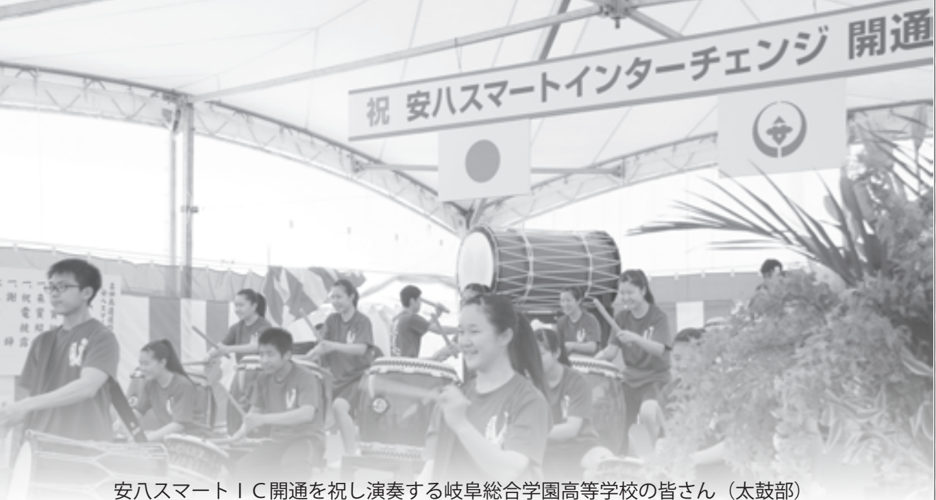
安ハスマートIC開通を祝い演奏する岐阜総合学園高等学校の皆さん（太鼓部）