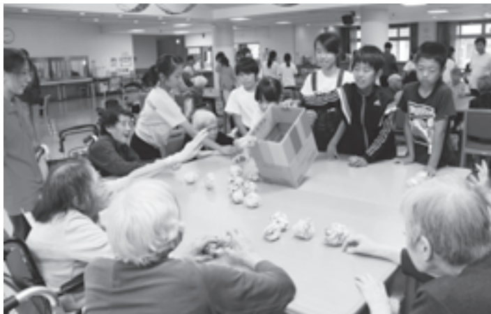
名森小児童と交流する入所者(あすわ苑)

一般・特別会計以外の会計予算をお知らせします。 介護保険を運営している広域連合・あすわ苑などは、経済的、効率的な運営を目的に複数の自治体で運営しています。