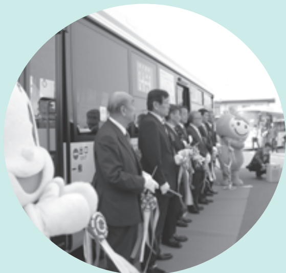
安八穂積線運行開始