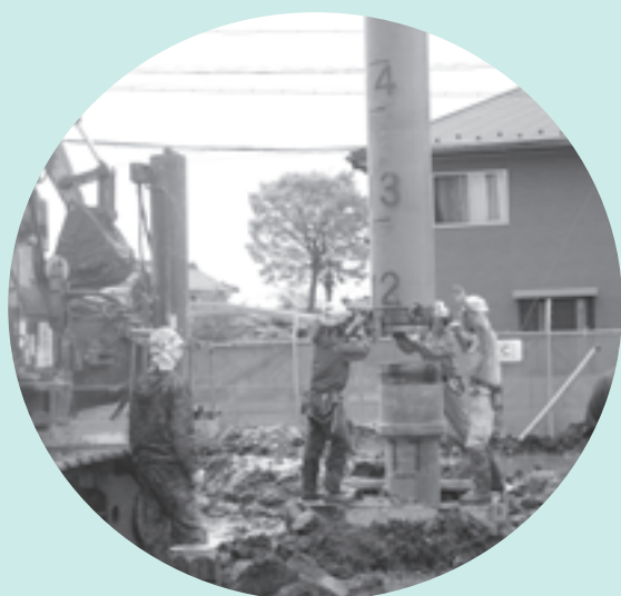
施設の杭打ち作業が始まりました