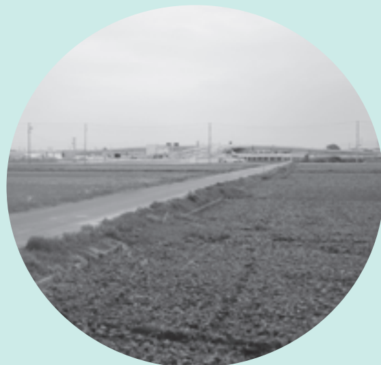
市街化区域拡大を進めていきます