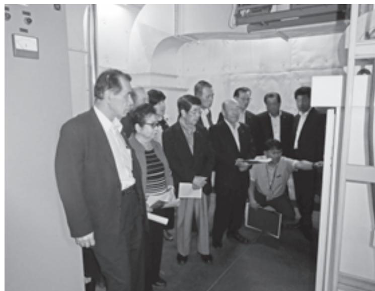
屋内消火栓非常用発電機が故障のため、現地を確認（中央公民館）