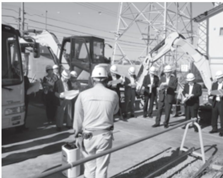
水道配水場更新事業の工事内容を聞く委員（水道事務所）

※一般会計補正予算に異議があったので表決をとり、審査の結果、賛成多数で原案どおり承認しました。