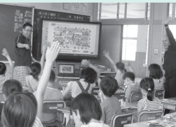
活発に手のあがる外国語授業（名森小3年生）

完全実施にするために、本年度全面实施の「小学校道徳科」と、「先行実施となる「小学校英語」は、町教職員研修会道徳部会や国際教育部会の教職員が、項目内容を決めたり、授業時間を増やしたりして本年度より実施しています。教育委員会として「授業が命」「子どもの姿で示す」という基本姿勢で、各種研修会で教職員が授業力を高めます。「たくましく生き、きり拓いていく子どもたち」を育てるため、若い先生とベテランの先生が「バディ」（ベテランの意欲化と若手の指導力向上・悩みの解消）というペアを組んでチーム力を高め、学校教育が充実するよう今後も取り組んでいきます。