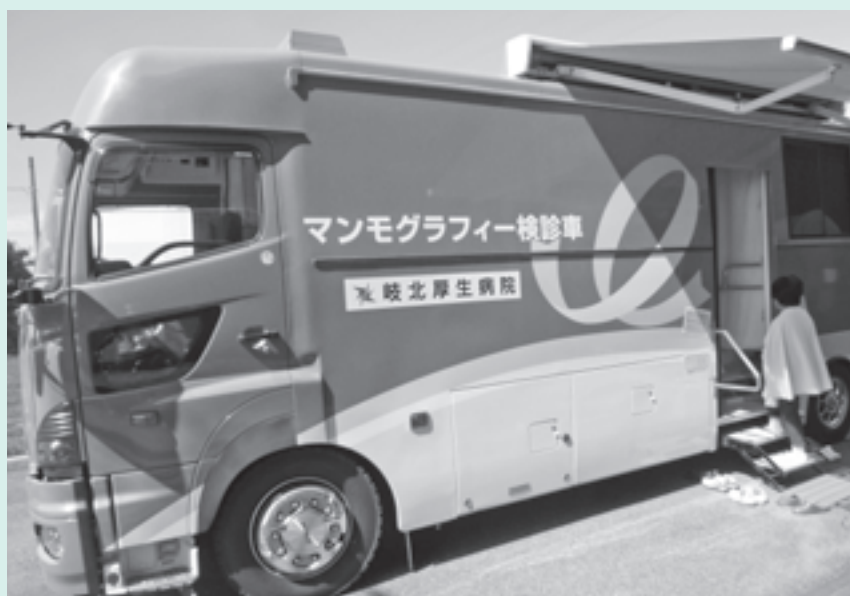
マンモグラフィーによる乳がん検診（保健センター）

今回の法改正である、事業主に対して雇用継続への配慮を求めることは、社会全体で考えていかなければなりません。当町としても進めていきたいと考えています。国や県で作成