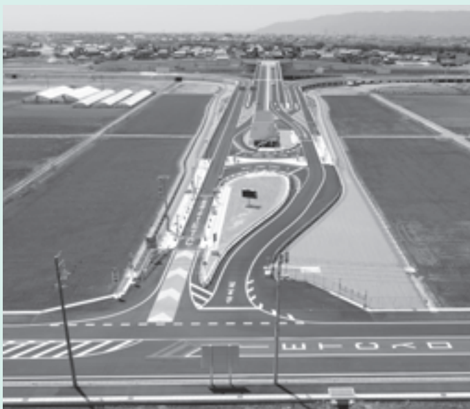
田園に伸びる安八スマートICを空中撮影

回答 平成20年度以降実施計画書の作成、騒音・振動・交通量調査、下水道管の切り回し工事・名神南道水路付け替え工事等で7億9200万円を見込んでいます。財源は、交付金3億6700万円、地方債2億6400万円、残りはスマートインターチェンジ建設基金と一般財源です。