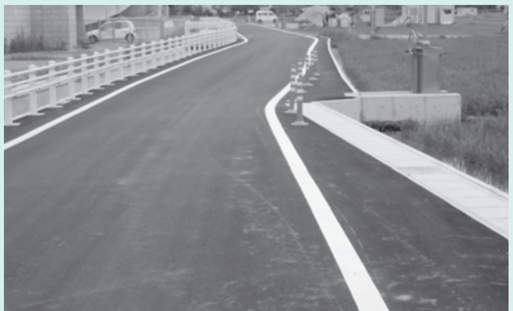
中地区に完成した名神高速道路南側道