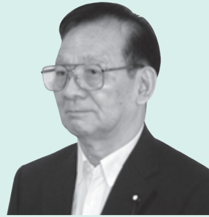
おいわ 岩 いわお まつ 西松