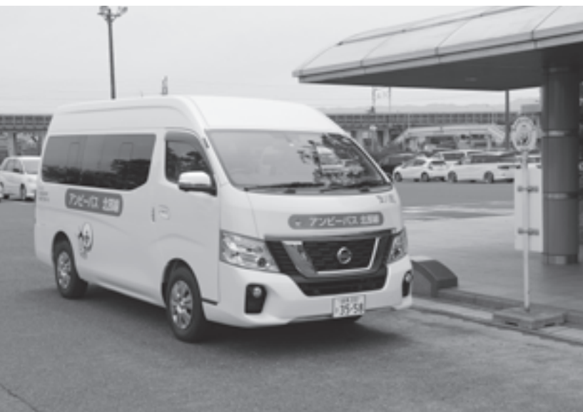
7月18日より新体系で運行開始のアンビーバス

福祉課長 保護者には8月に開園について説明会を実施します。10月に入園案内を広報紙に掲載し、11月に受け付けします。移行のスケジュールは、9月までに県へ設置認可申請書を提出、県の審査が12月までに行われ、その間にヒアリングを受けます。平成31年1月に県の認可が下りる予定で、2～3月に開園に向けて準備し、4月開園の予定です。