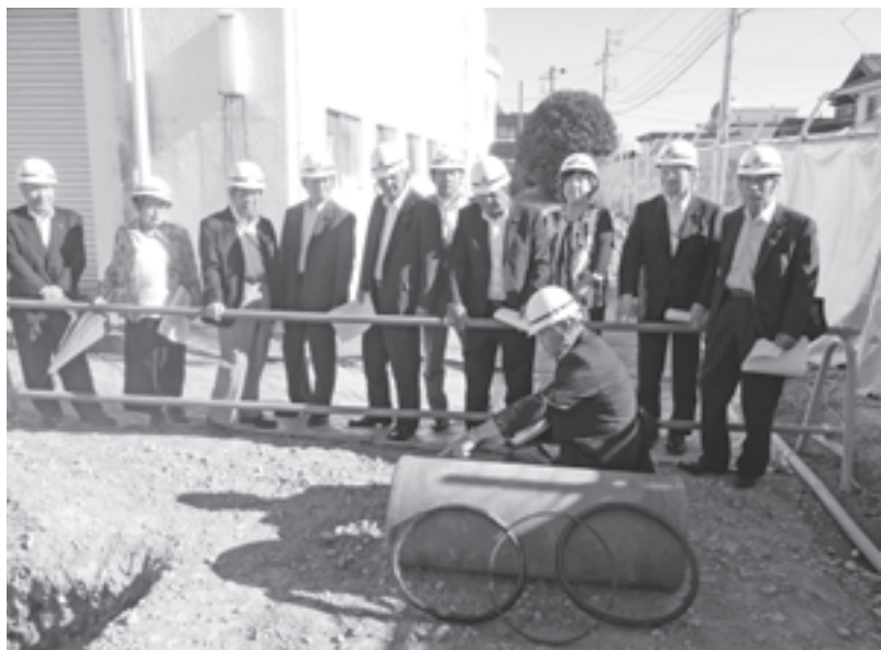
断水（4/26）の原因となった水道配管材を確認（水道事務所）