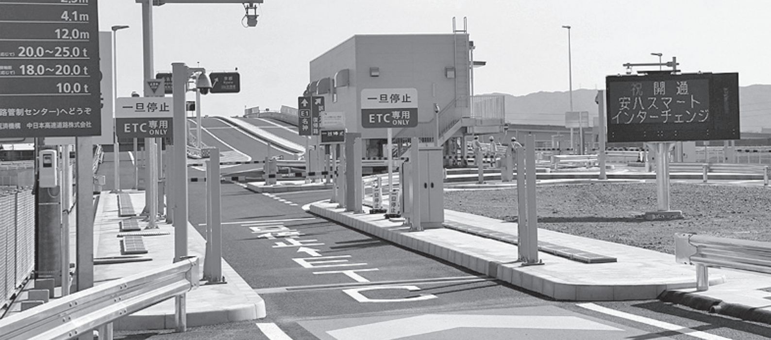
安八町の活性化が託されている安ハスマートIC入口