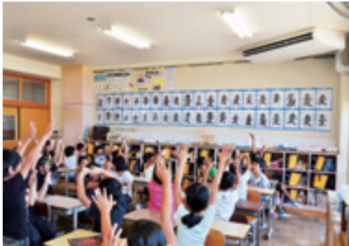
▲小学校に整備された空調設備