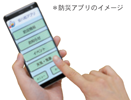
*防災アプリのイメージ