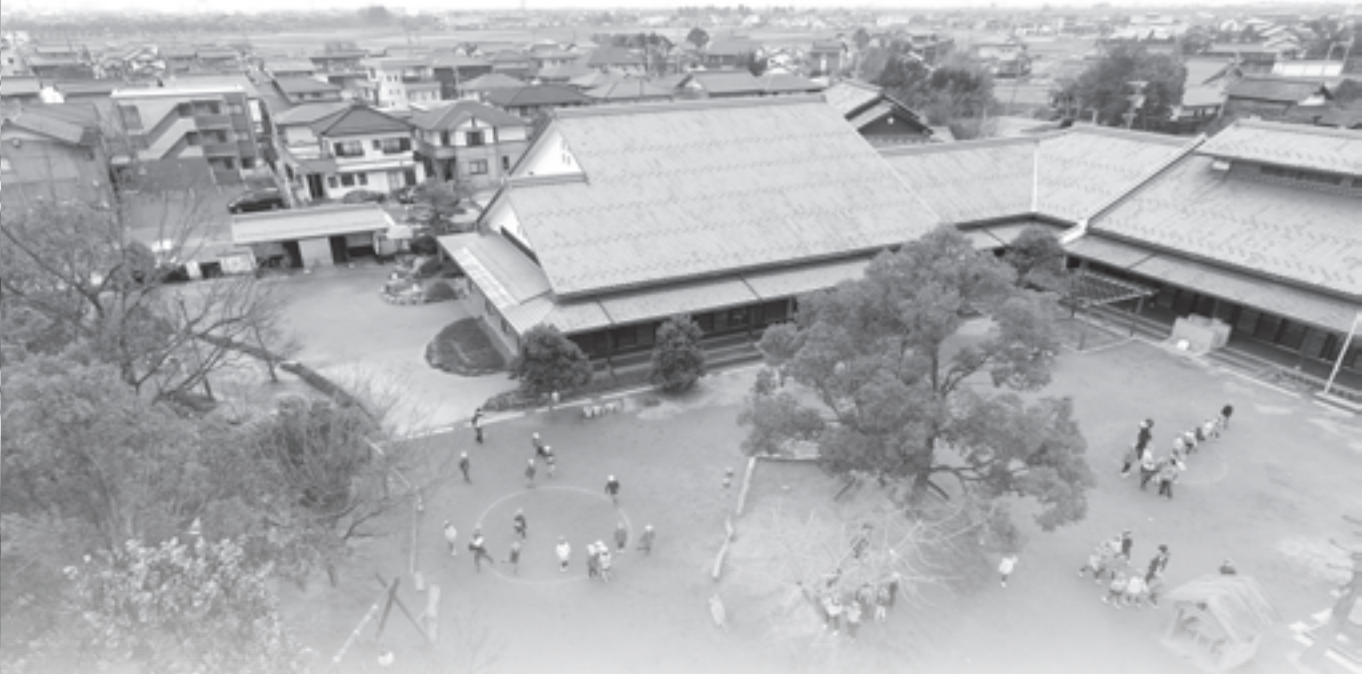
4月から始まった認定こども園(中央こども園)