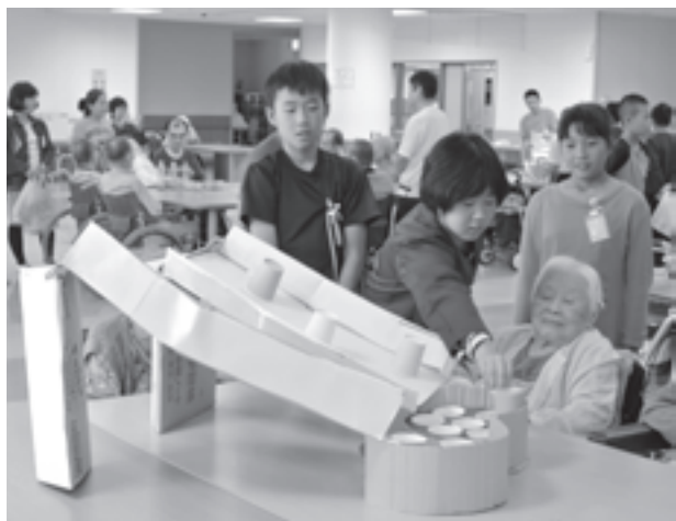
名森小児童と交流する入所者(あすわ苑)

一般・特別会計以外の会計予算をお知らせします。 あすわ苑・介護保険を運営している広域連合などは、経済的、効率的な運営を目的に複数の自治体で運営しています。