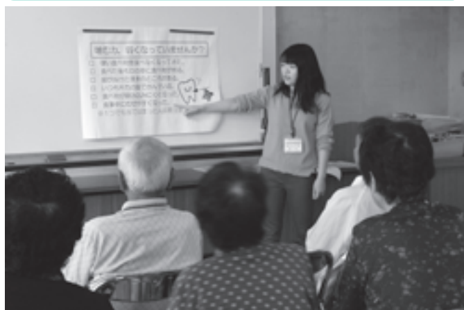
高齢者への歯科指導（ほうれんそうの会にて）