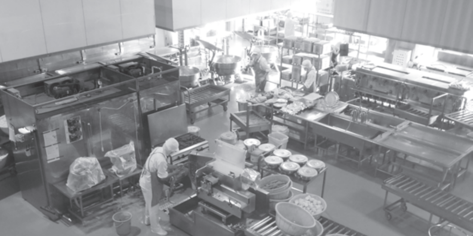
現在、臨時職員が多く働く給食調理室（給食センター）