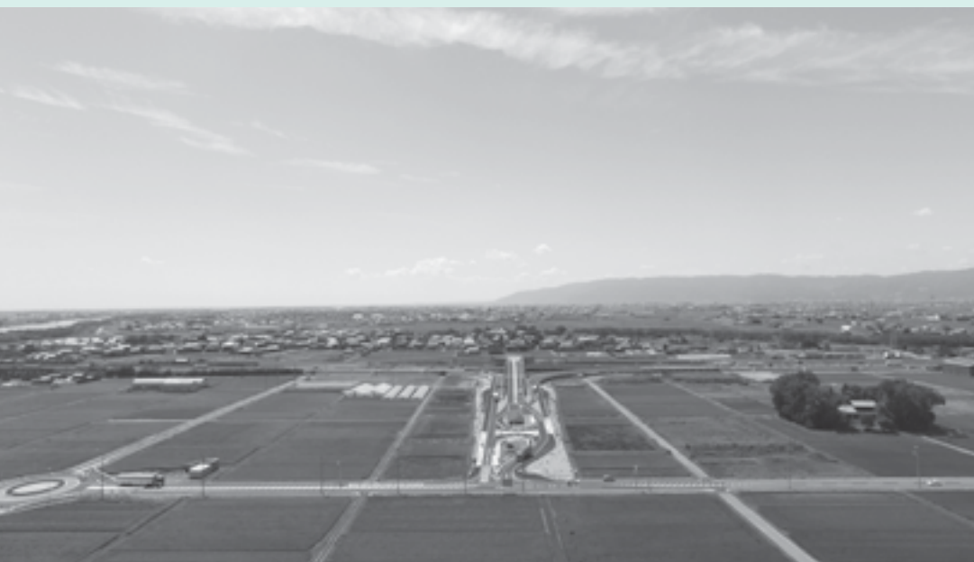
スマートIC周辺の市街化拡大予定地

で、当町は、20万㎡の要望を出しました。この難事業を完成させたいと思います。存在感あふれるまちとして存続していくためにも、これからのまちに豊かなまち安八町を将来がかかった大きな飛躍となりますので、そして、未来を支える子どもたちや若者たちをつないでいきたいと考えています。