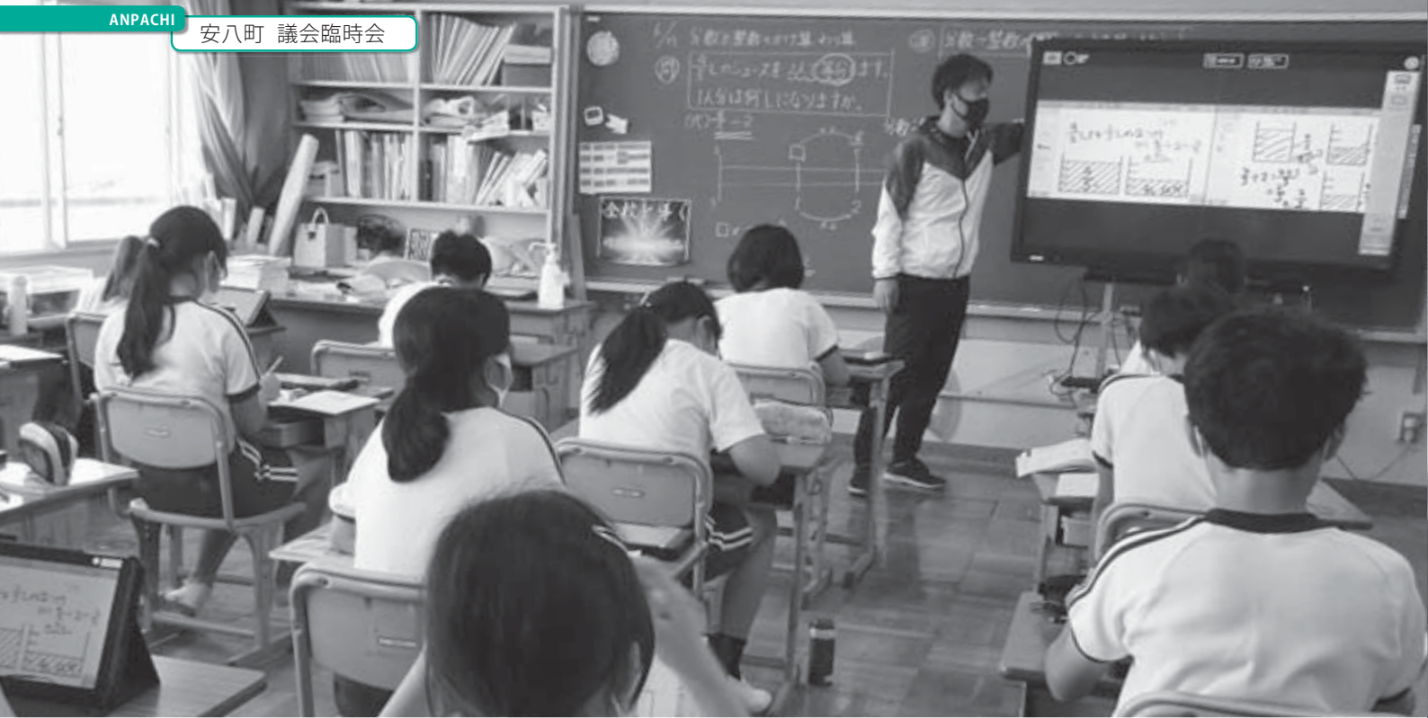
ICT教育の先駆けとして導入され活用されている電子黒板(牧小学校)