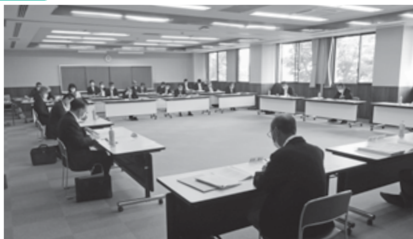
間隔を空けるため、場所を大会議室に変更した委員会

建設課長 公共施設の総合管理計画に基づき、耐用年数45年を迎えるので、現在の入居者の転居対策も併せて、施設の今後を検討をしていきます。