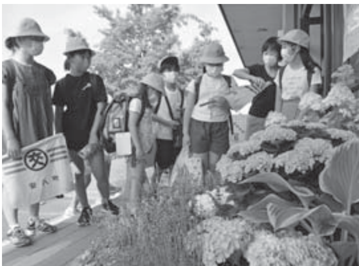
校舎の入り口に植栽されたラベンダーとあじさい

災害発生時、避難所での密な状態や暑さを避けるため大型冷風機を整備。当面は空調機のないことも園で暑さ対策に活用。