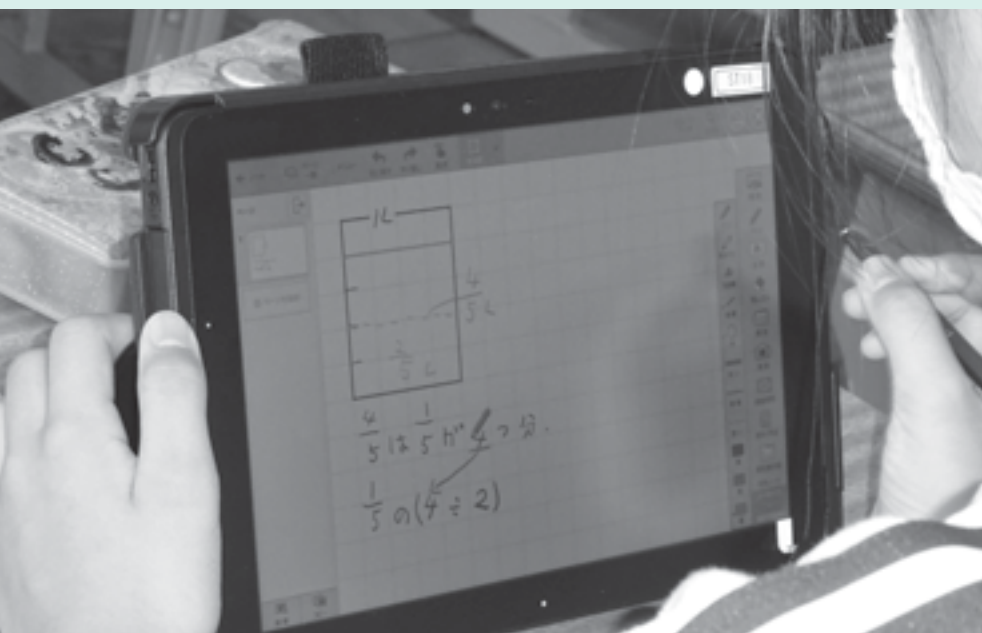
現在授業で使用しているタブレット