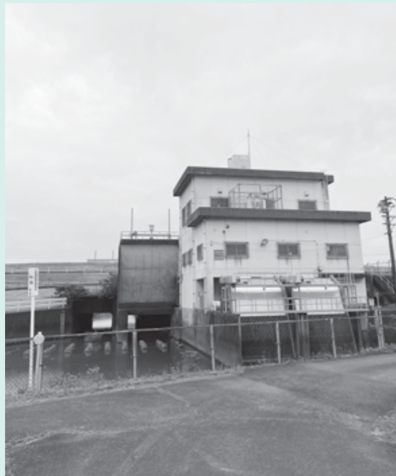
老朽化が懸念される森部排水機場

報が出たときには は排水機運転手、水門 管理者、地区の区長さ んと連絡を取り万全の 体制を取ります。