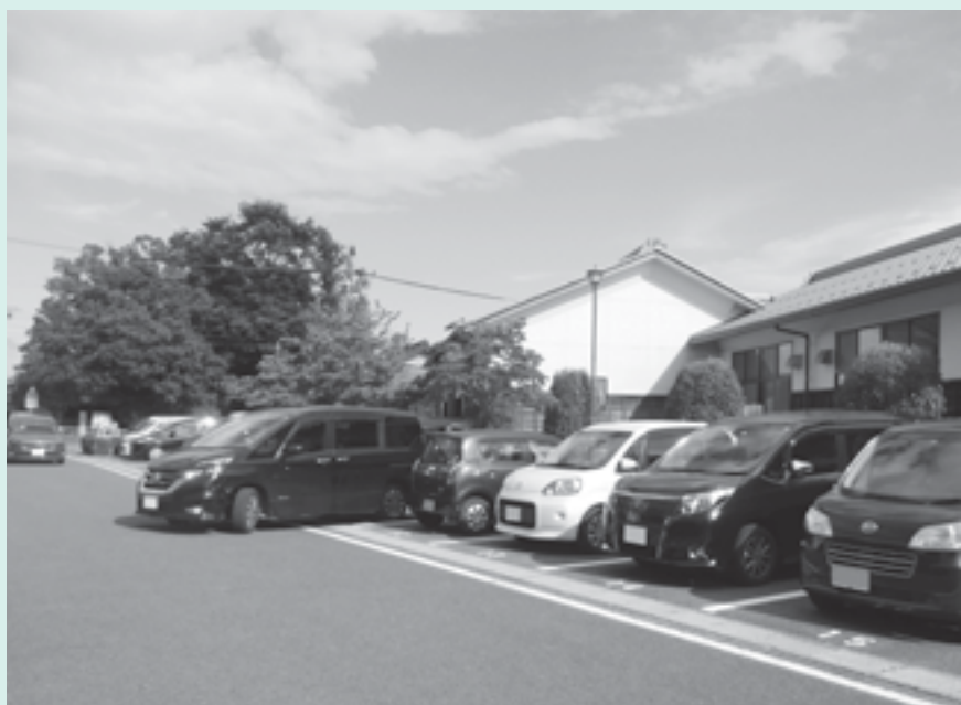
送迎の車でいっぱいのこども園の駐車場

100人程度で推移し、 今後90〜100人の間 で続くものと思われ、 近い将来、6つあるこ ども園の統合は避けら れないと考えています。 統合されると1つの 園の園児数が増え、そ れに比例して送迎が増 えると懸念されますが、 当町は南北わずか10km 足らずの距離です。送 迎バスに長時間乗って