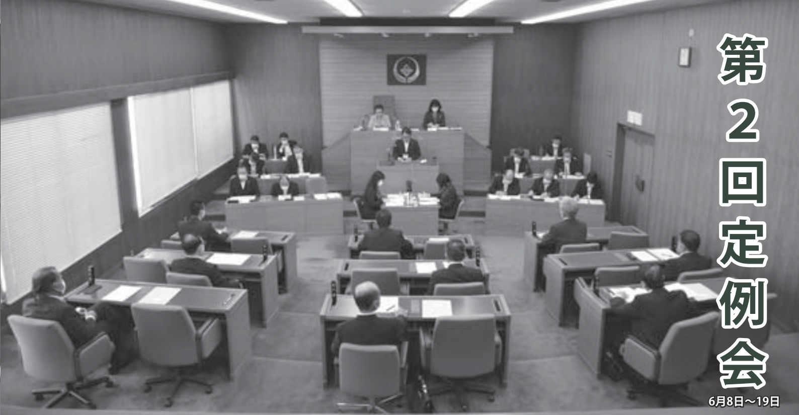
新型コロナウイルス感染症対策がされた議場