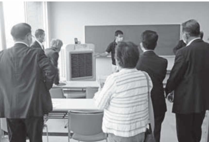
この夏こども園で活用される大型冷風機

高校生の医療費を、来年度から無償化とするためにシステム改修などを行い、準備を進めます。