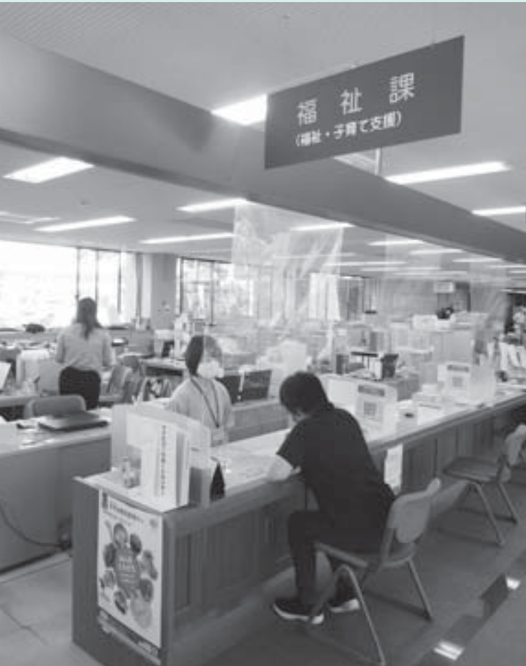
飛沫対策がされている役場の窓口