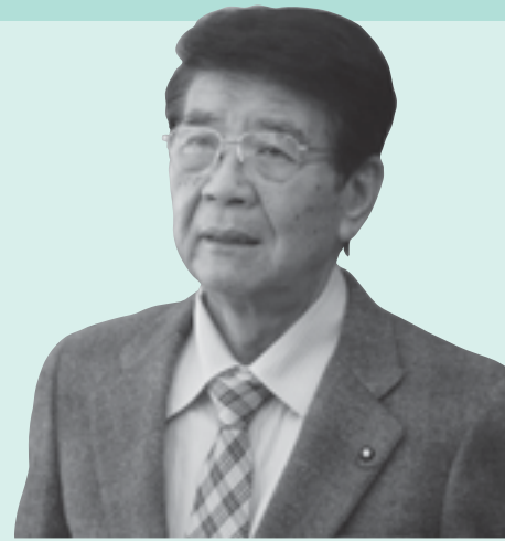
あき お 夫 あき お 昭 夫 うす い 碓 井