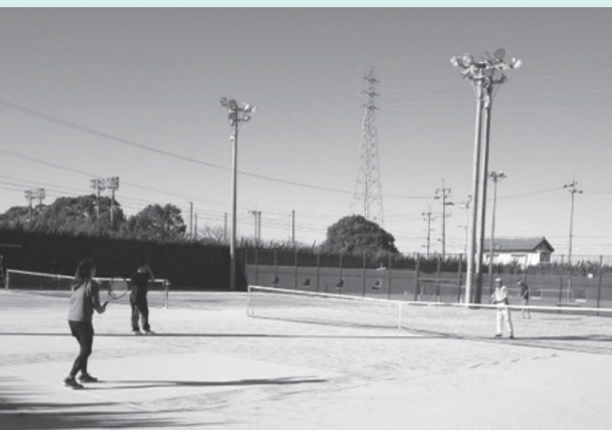
テニスを楽しむ人たち（安八テニスコートにて）

ふるさと納税の使用目的に、スポーツ振興の項目を設けます。また、多目的広場などは、次期第六次総合計画の作成時に取り進む方向で検討します。