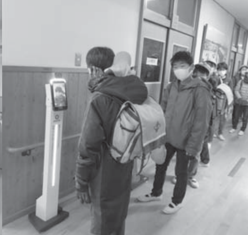
サーモグラフィーで体温を測る児童(名森小)