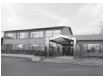
再生が望まれる勤労青少年ホーム

建物の劣化診断を行っています。調査結果を踏まえて改修を行い、有効に活用する方向性を検討します。