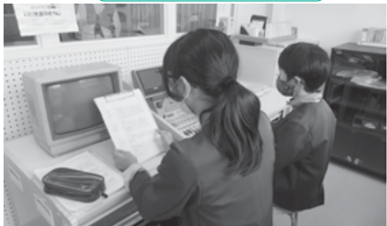
改修が必要な名森小学校の放送設備

Q 落雷での故障だと聞いていますが、保険の対応はできないのですか。 学校教育課長 現在保険会社に請求中ですが、学校では必要な器材なので、早急に改修をします。