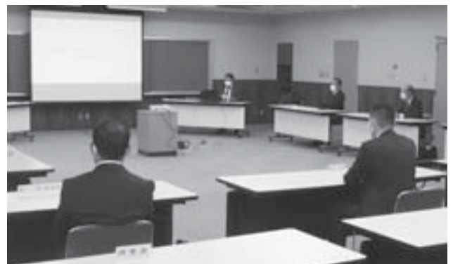
プロジェクターを使用して発表する議員

市）で開催された「議会改革を考える～先進事例に学ぶ住民参加・情報公開～」をテーマとした議員研修を受講した議員3人による研修発表を行いました。研修の成果を今後の議会改革に役立てていきたいと考えます。