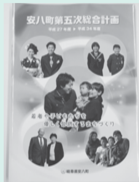
安八町第五次総合計画