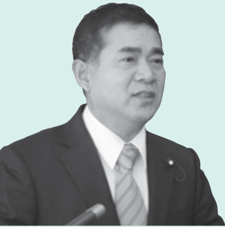
ばん 坂 さとる 悟