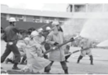
機動演習風景 (議会だよりNo.67号掲載)

平成29年度に機能別消防団員として、役場消防隊を職員10人で編成しました。社会情勢の変化により、今後に対応していきます。