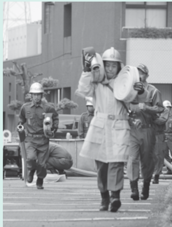
火災防御訓練中の消防団員

えていく必要があると 考えています。消防団 の再編成なども視野に 入れながら、団幹部や 各地区の人と協議を重 ねていくとともに、時 世に合った最善な消防 団運営を図っていきた いと思います。