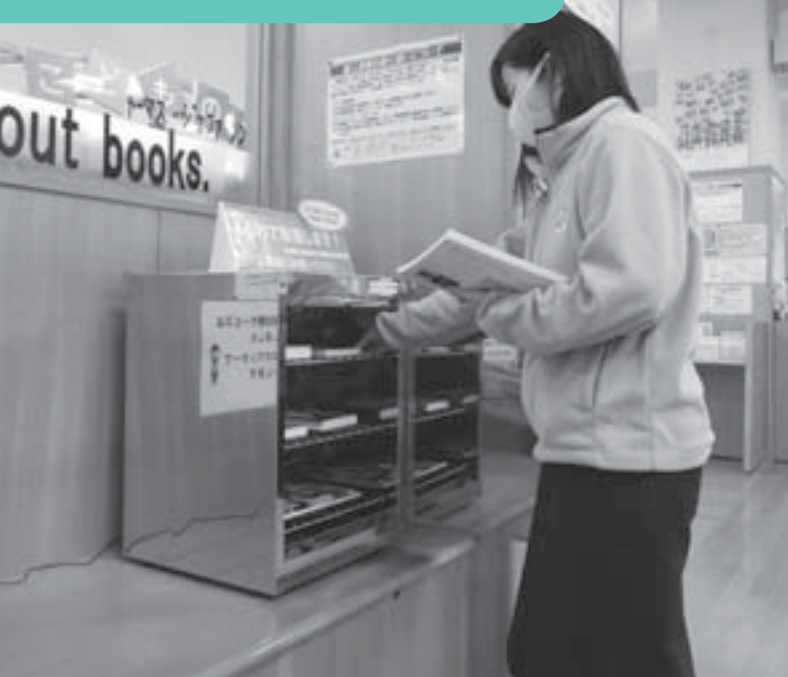
本の除菌ボックス(ハートピア安八図書館)