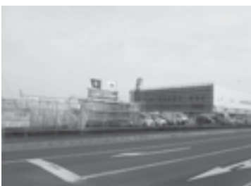
町に進出する企業 (議会だよりNo.77号掲載)

企業誘致は継続的に行っています。安八穂積間バス路線は利用が少ないためPRの拡充に努めています。高速道路のバス停は検討中です。