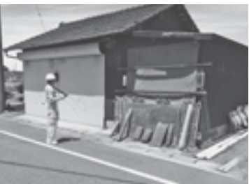
空家調査 (議会だよりNo.71号掲載)

継続的に空家相談会を開催しています。令和2年度から空家の除去を支援するための補助金を創設しました。