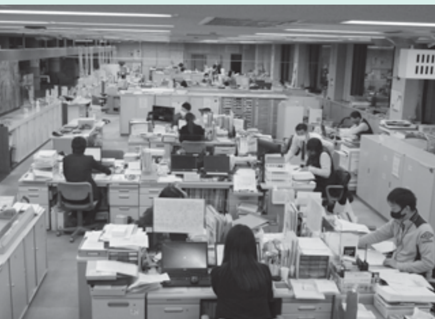
BCPは役場の業務を優先順位に従って再開する計画です

今年度は、行政機関全体に係る項目の素案策定を目指しています。来年度は、所属ごと、または所属間を横断した場合の非常時優先業務の素案策定を完了させ、年度末には、平成28年3月策定の「新型コロナウイルスエンジェル等感染症対策版」および、平成29年2月策定の下水道事業「業務継続計画」を網羅すべく、大規模災害時に、早期に行政機能を回復させるための計画の策定が完了するよう進めていきます。