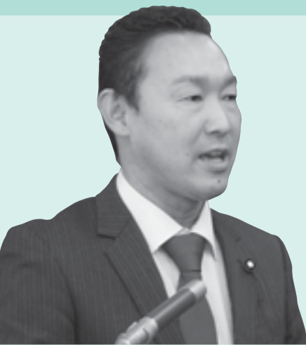
ひろく ぼん 邦博 市長 まぼし ぼん ぼん 市長