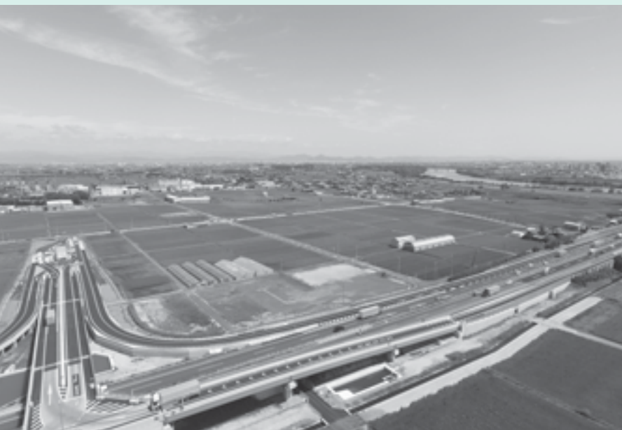
企業誘致を進める工業地域