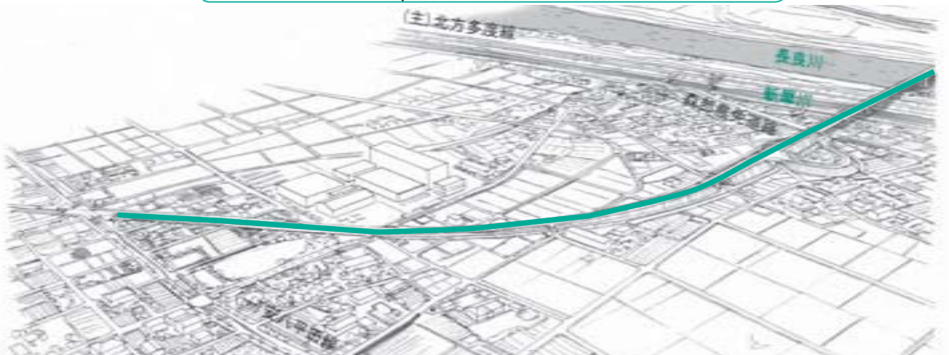
大垣江南線長良川新橋（仮称）イメージ図

現在通行止等が必要となる危険な橋はありませんが、修繕を必要とする橋が5橋あり、そのうち2橋が架け替えや修繕が完了し、残り3橋は順次改修を行う予定です。