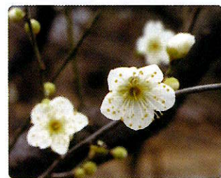
月の桂(つぎのかつら)