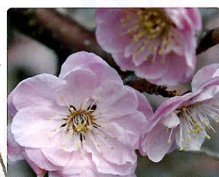
桜鏡(さくらかがみ)