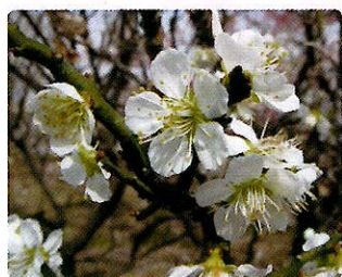
金獅子梅(きんじしばい)