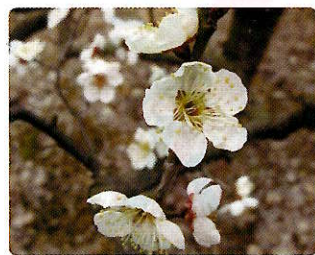
水仙梅(すいせんばい)