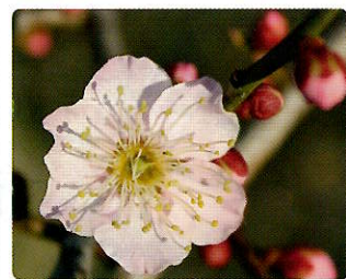
紅冬至(べにとうじ)