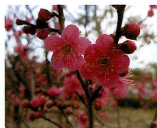
大盃(おおさかずき)