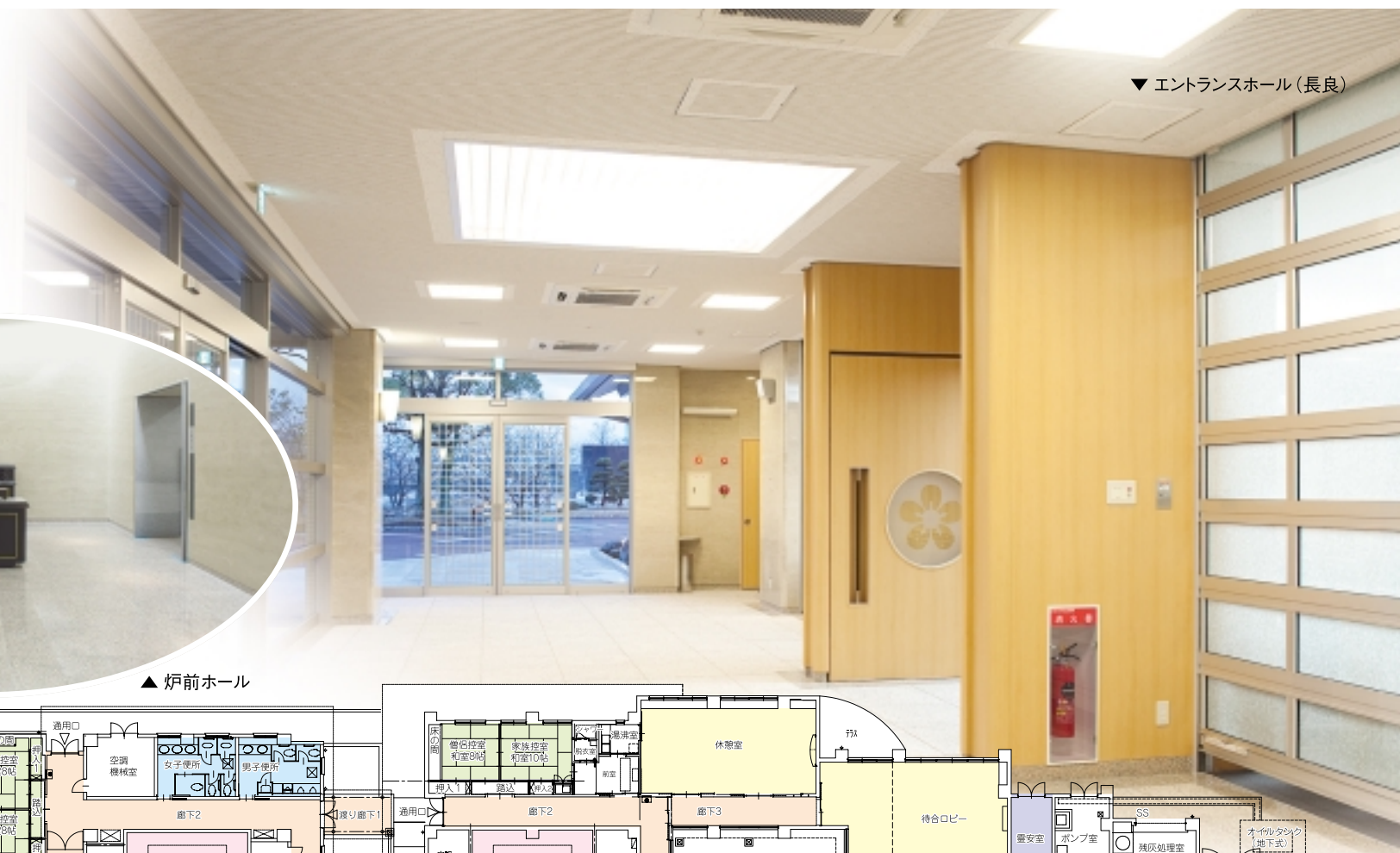
▼エントランスホール(長良)