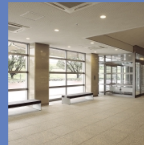
▲エントランスホール(揖斐)