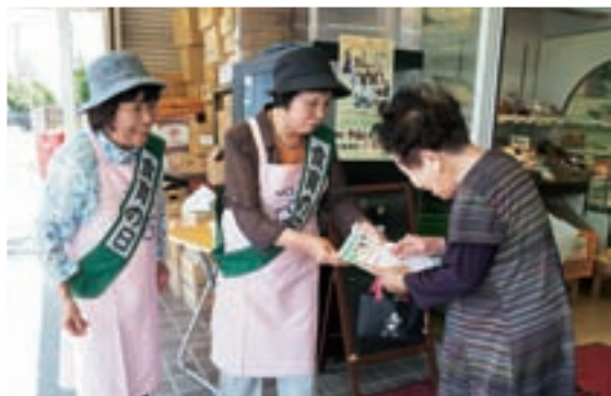
▲リーフレットを手渡して食育の普及

当日は、スーパーに訪れた方1人ひとりにリーフレットを配布しながら、保護者と子どもと一緒に食事をする『共食』の呼びかけと、かつお節パックを配布して、だしを用いると『減塩』に繋がることを伝えていました。