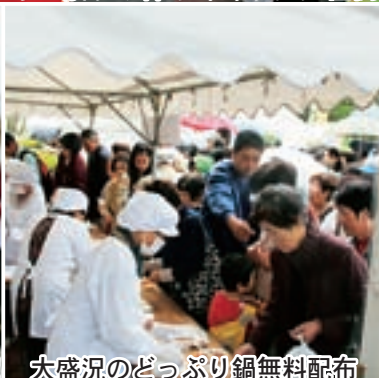
大盛況のどっぴり鍋無料配布