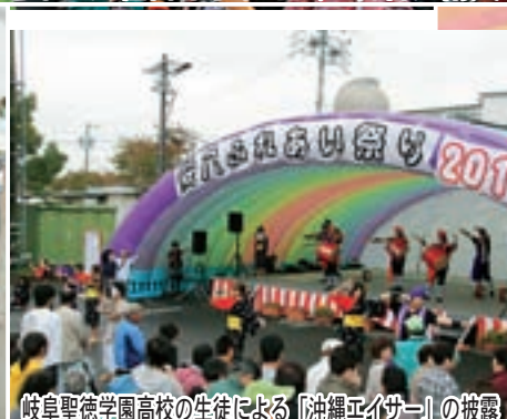
岐阜聖徳学園高校の生徒による「沖縄エイサー」の披露