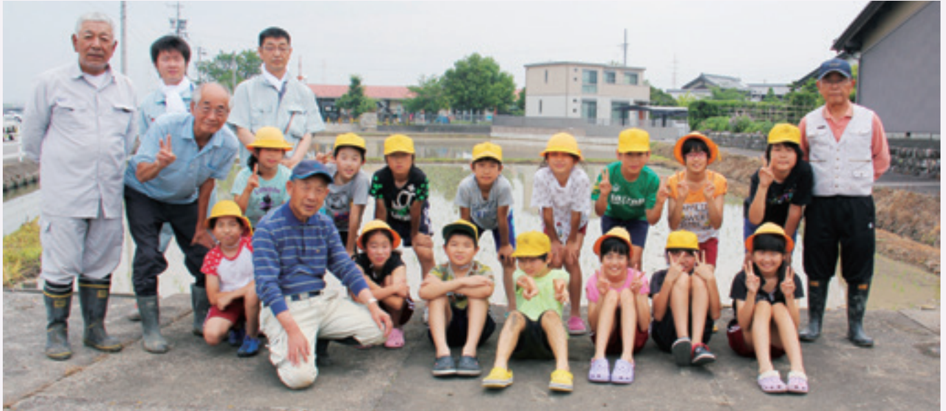
▲田植え後に区長さんたちと一緒に