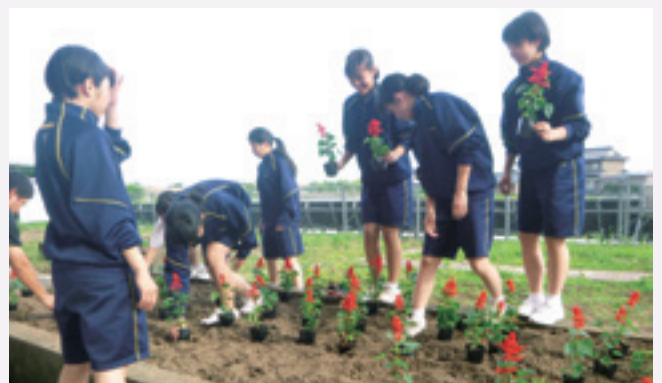
▲丁寧に作業をしました