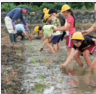
▲教えてもらいながら