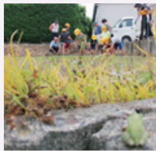
▲約30分で植え終わりました