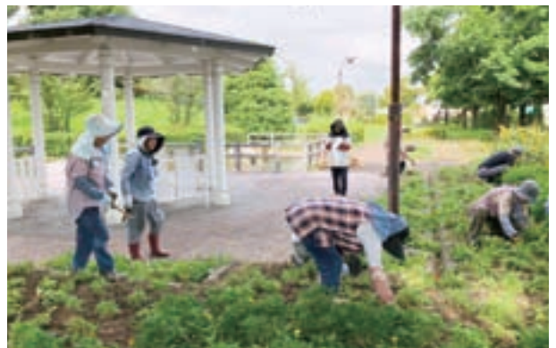
▲交流も楽しみながらボランティア活動を行っています

ボランティアの参加は随時受け付けています。詳しくは生涯学習課（☎64-4343）へお問い合わせください。