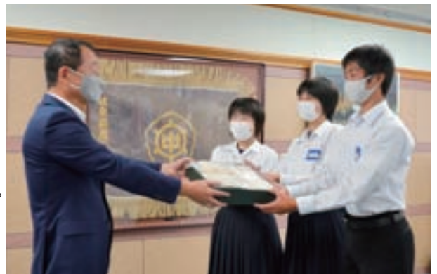
▲堀町長にマスクを手渡す生徒会役員