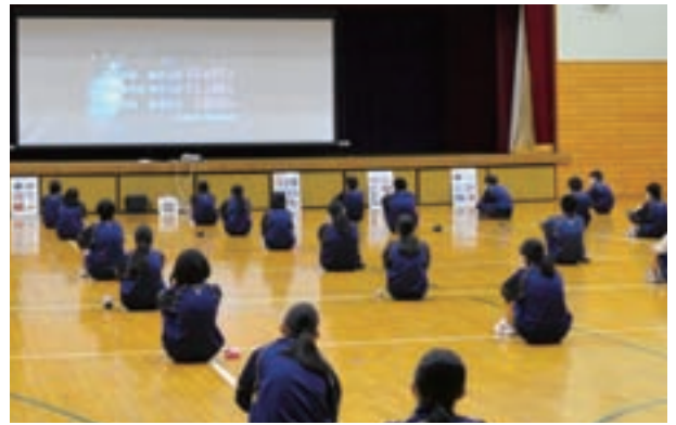
▲薬物の恐ろしさについて真剣に学ぶ生徒

薬物の恐ろしさについて学んだ後、代表生徒は「薬物は本能的に欲するようになってしまい、人の心と身体を確実におしぼみ、自分だけでなく家族や大切な人まで巻き込んでしまうのが怖いと思いました。岐阜の高校生でも薬物で逮捕された人がいるのも驚きました。一度手を出してしまうと後戻りできないので、今日学んだ“逃げる勇気”“断る勇気”を持って生活していきます」と話してくれました。