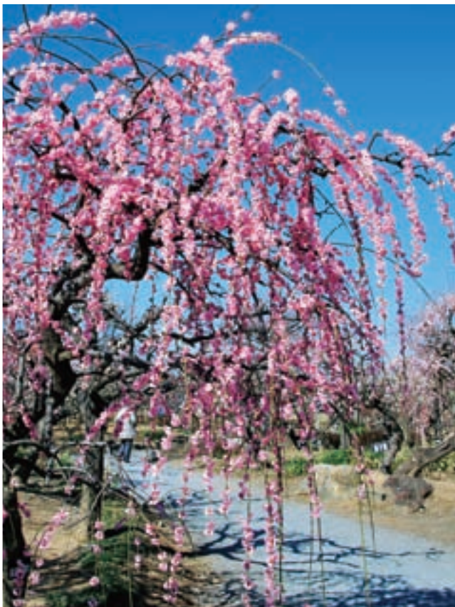
▲ 見事な梅花で来園者をおもてなし (左)・新成人モデルの撮影会 (右) 【※写真は平成25年に撮影したものです】

安八園遊会は3月2日(日) 午前10時からです。 ※新成人をモデルに迎えるの撮影会もあります！