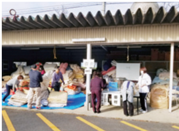
▲令和2年ふとん回収の様子