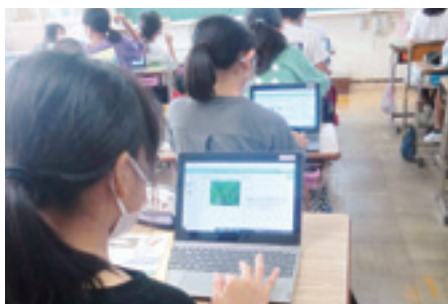
▲タブレットをつかって授業を受ける児童