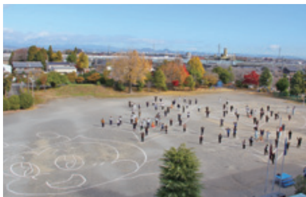
▲星の図形と支部員の方々が描いたアンビー

代表児童は「測量機器でとても正確に角度や距離を測ることができて驚きました。自分たちで作成した図形が綺麗な星型になっていてうれしかったです」と話してくれました。